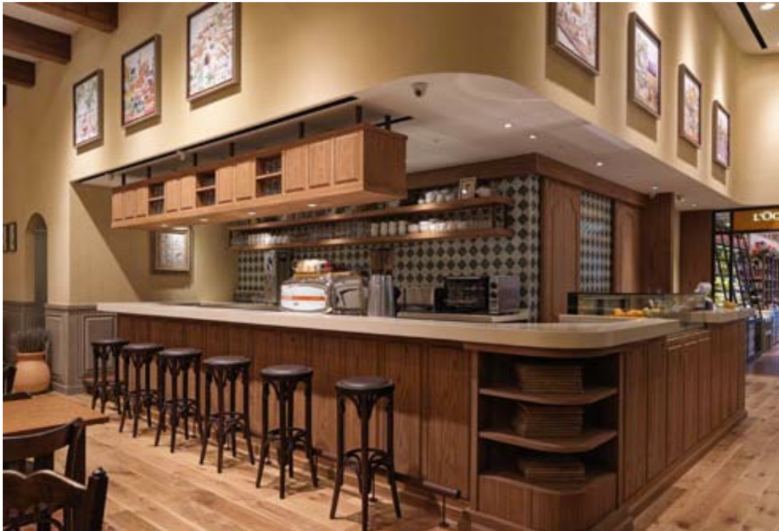
カウンターエリア