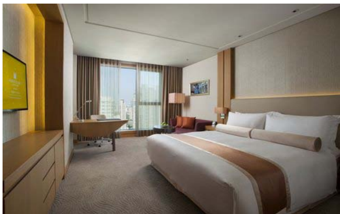
クラブキングルーム