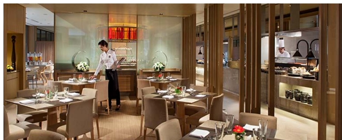
ホテル内レストラン