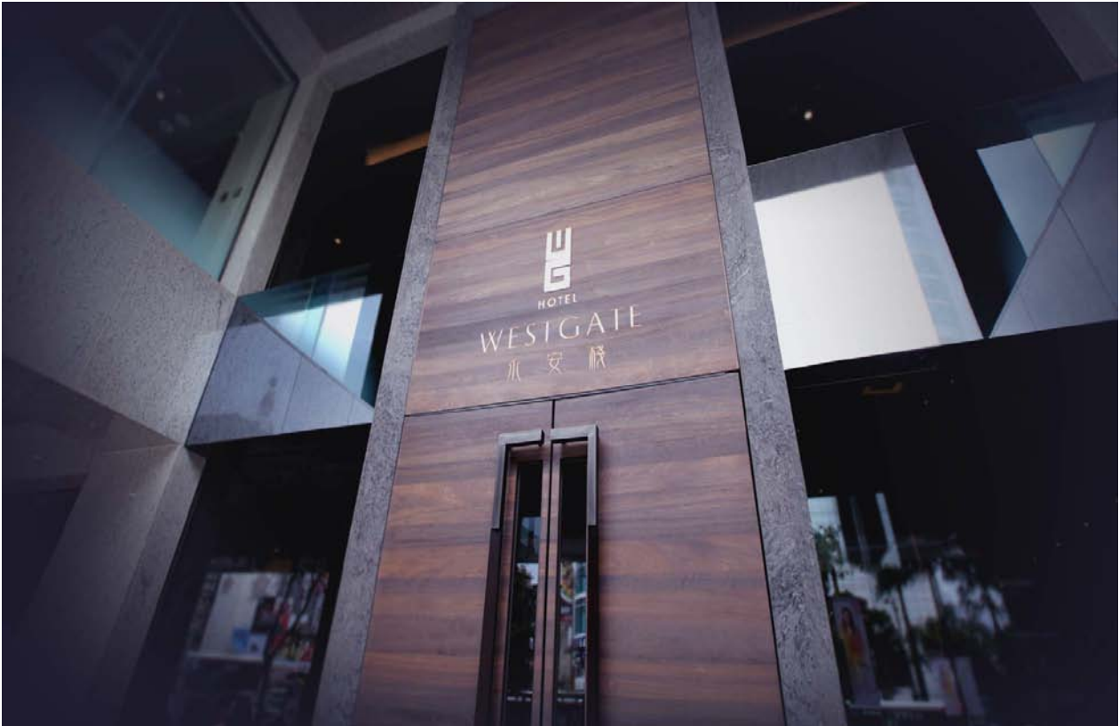
ホテルエントランス