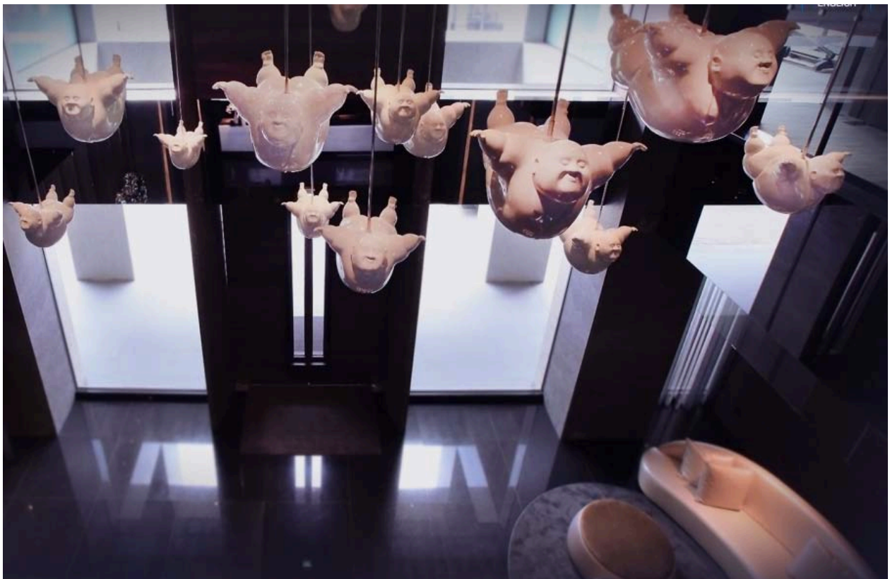
エントランス上のアートワークはウェブサイトにも登場するホテルのモチーフキャラクター