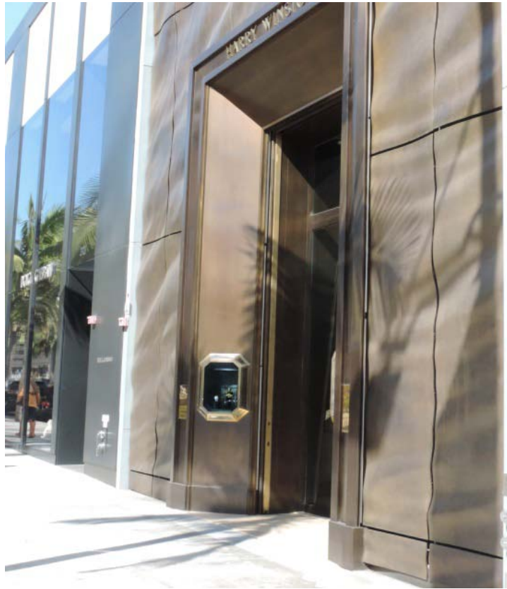
Harry Winston facade with wave shaped & baked aluminum panels and jewel like window box displays.