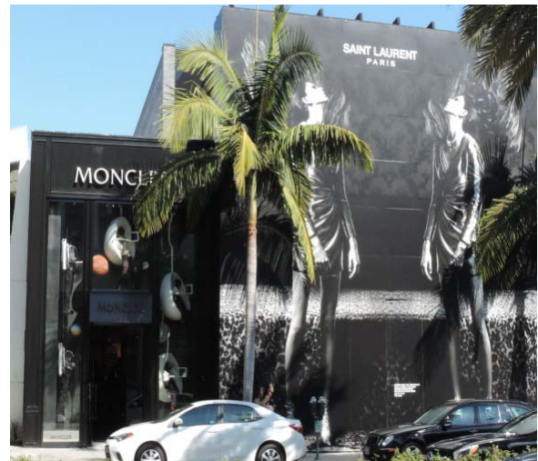
Tory Burch Flagship store and Bulgari new façade in shell stone. Gucci store is under construction. Moncler and YSL are located next to a Frank Lloyd Wright building