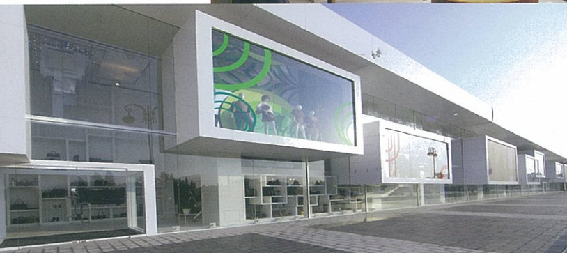
EMPORIUM Shopping Mall Baku | Azerbaijan