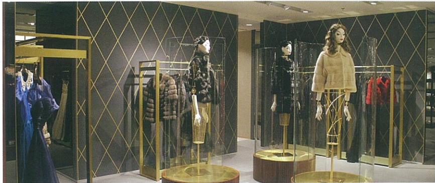
NEW EMPORIUM Shopping Mall Baku | Azerbaijan

GARDE is specialized in the creation of unique and timeless spaces. Whether we design the interiors of luxury fashion stores, boutique hotels or high-rise residences, we continually strive to deliver the special brand of Japanese design aesthetics that has appealed to our clients for almost for the past 30 years. Thanks to our global network, team of talented designers and cutting-edge knowledge of the latest trends, we are able to translate our clients' vision into inspiring results. We are committed to supporting our clients' design needs via our three pillars of expertise - Consulting, Design and Coordination.