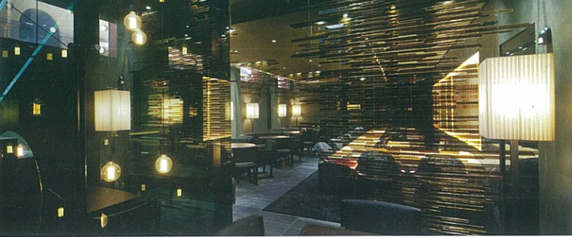
SUSHI B Restaurant Milan | Italy

GARDE is specialized in the creation of unique and timeless spaces. Whether we design the interiors of luxury fashion stores, boutique hotels or high-rise residences, we continually strive to deliver the special brand of Japanese design aesthetics that has appealed to our clients for almost for the past 30 years. Thanks to our global network, team of talented designers and cutting-edge knowledge of the latest trends, we are able to translate our clients' vision into inspiring results. We are committed to supporting our clients' design needs via our three pillars of expertise - Consulting, Design and Coordination.