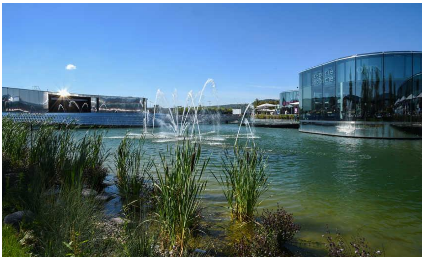
(レストランエリアと池)