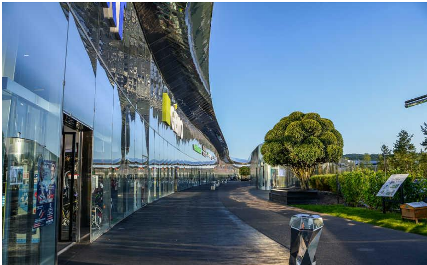
(ショッピングエリア)