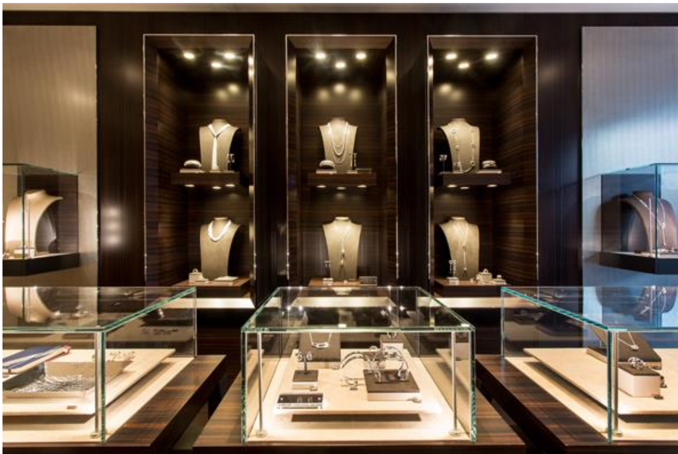
(店内ディスプレイ 1)