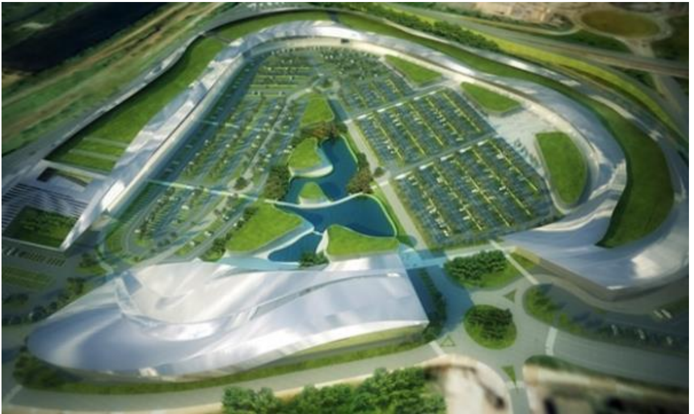
(ショッピングセンター全体イメージ)