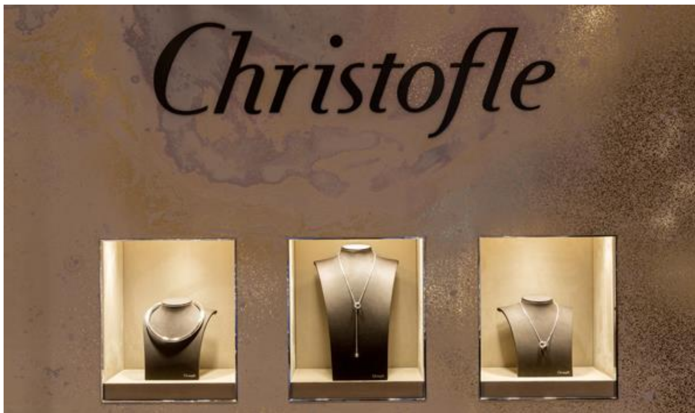
(店内ディスプレイ 2)