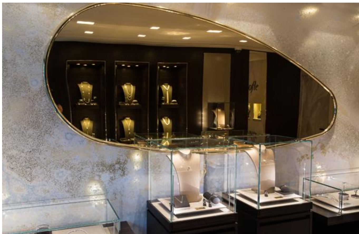
(Hervé Langlais 氏のミラーMUSE)