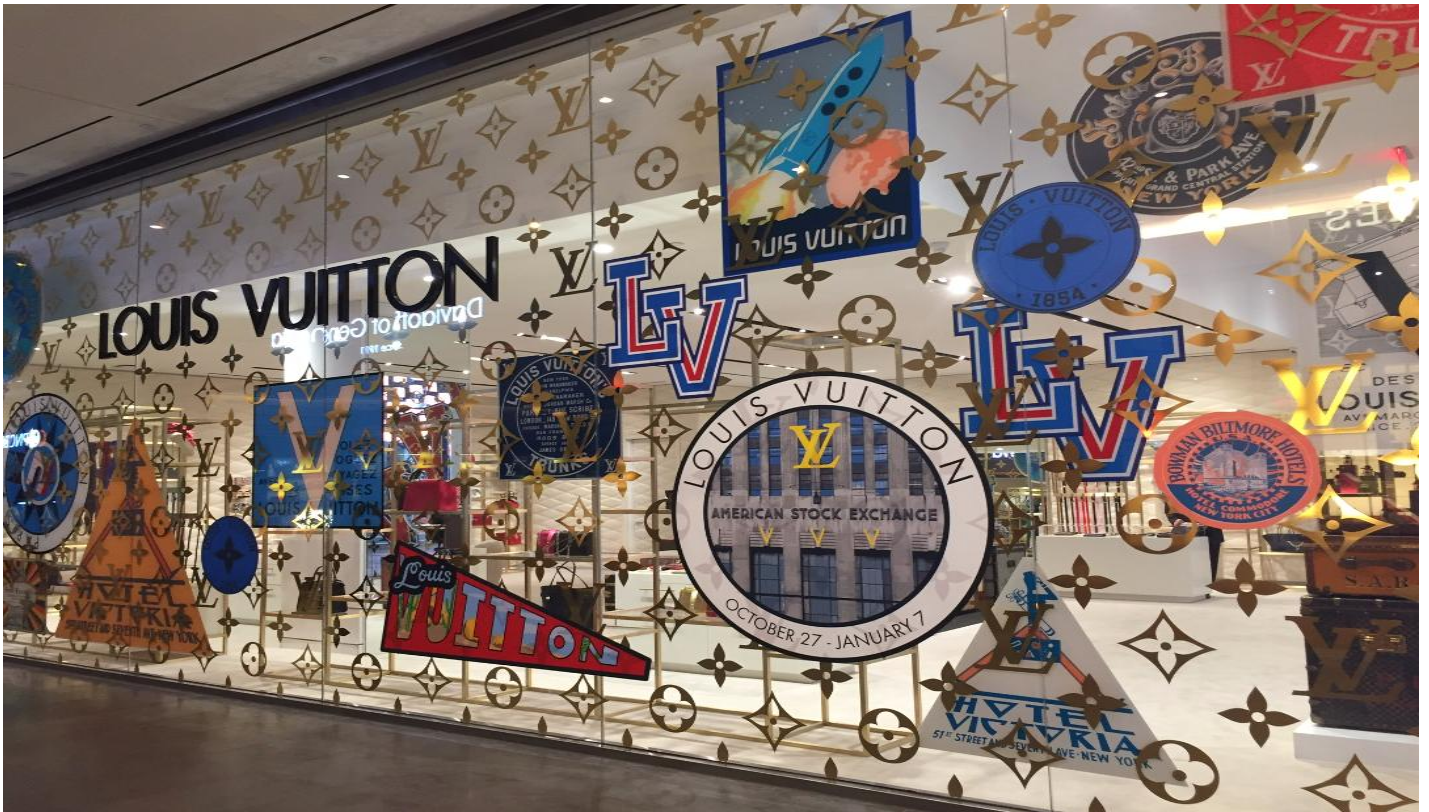
(展示会場近くのファッションモール内で行われている Pop-up Store)