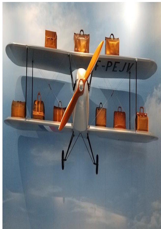
(トランクの蓋をフラットにしたことから始まったルイ・ヴィトンの快進撃は旅スタイルの変化とともに進化)