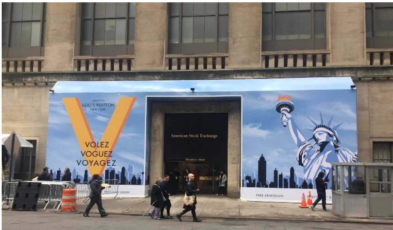
(旧アメリカン証券取引所のオリジナルのファサードを利用した入口)