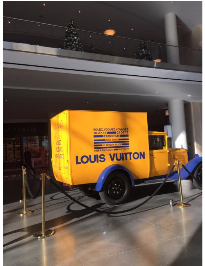
(モール内で展示されているカスタマイズカー)