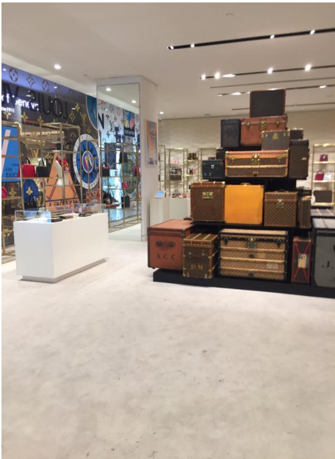
(展示会のテーマとシンクロする旅テーマの商品を販売)