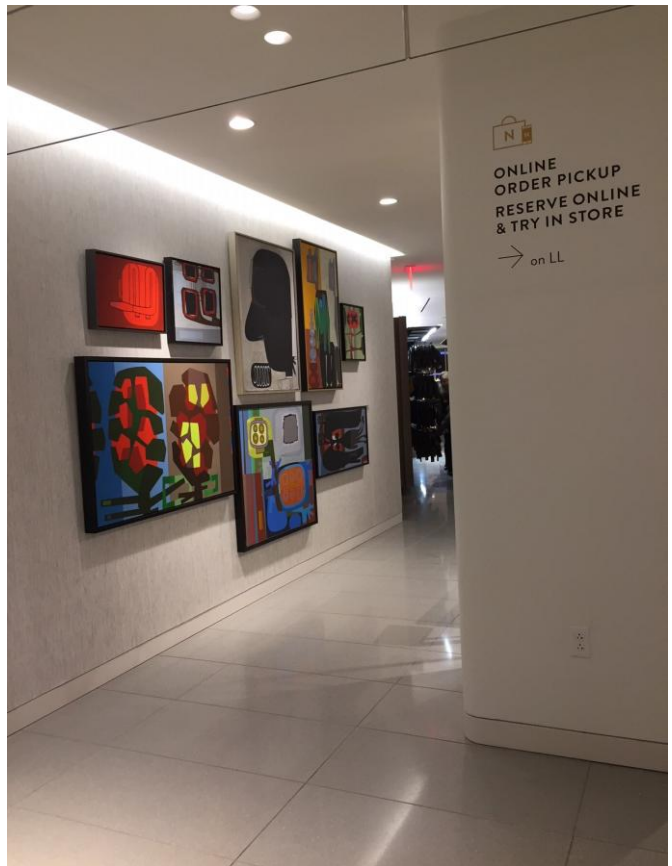
モダンアート作品をふんだんに展示