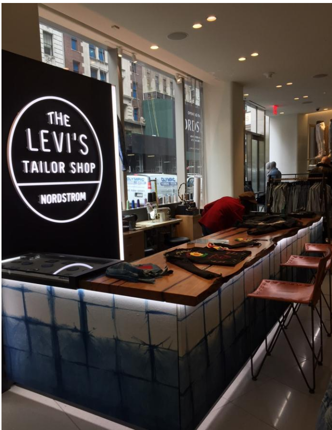
リーバイスをカスタマイズできる専用カウンター