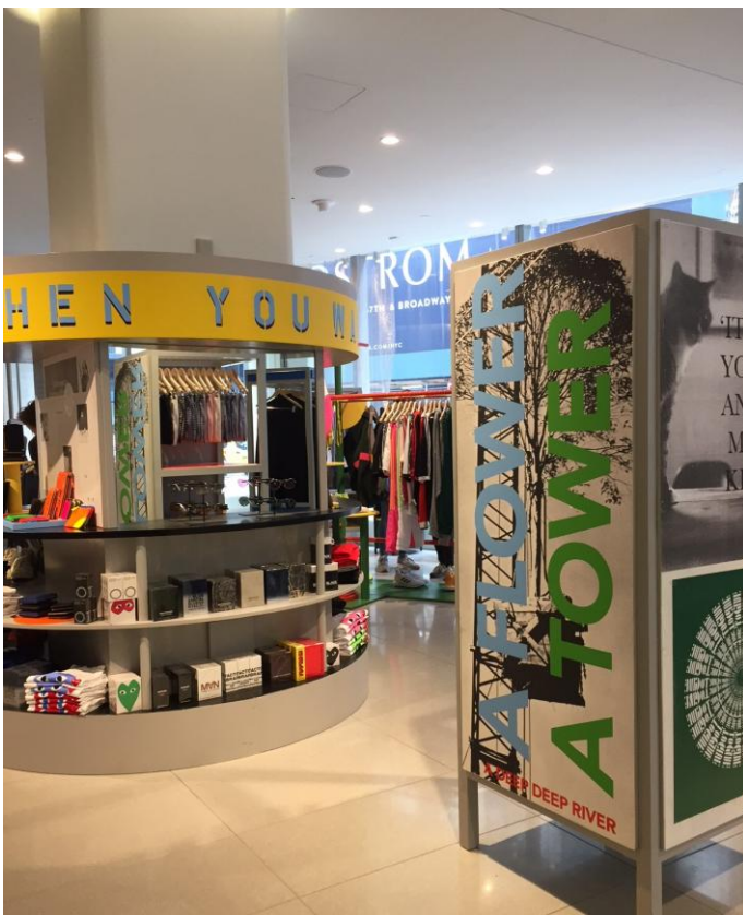
コムデギャルソン