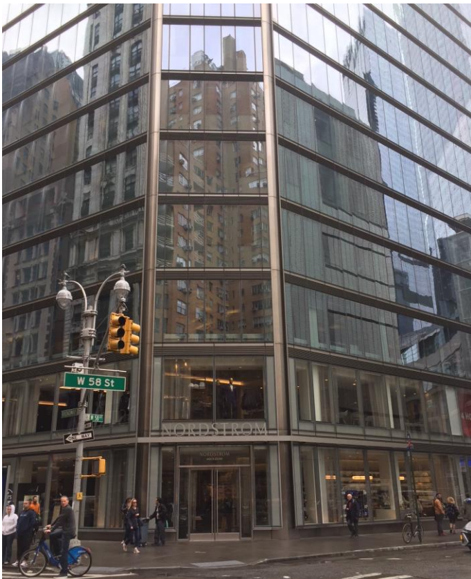
正面ファサード 向かい側には来年レディース本館がオープン