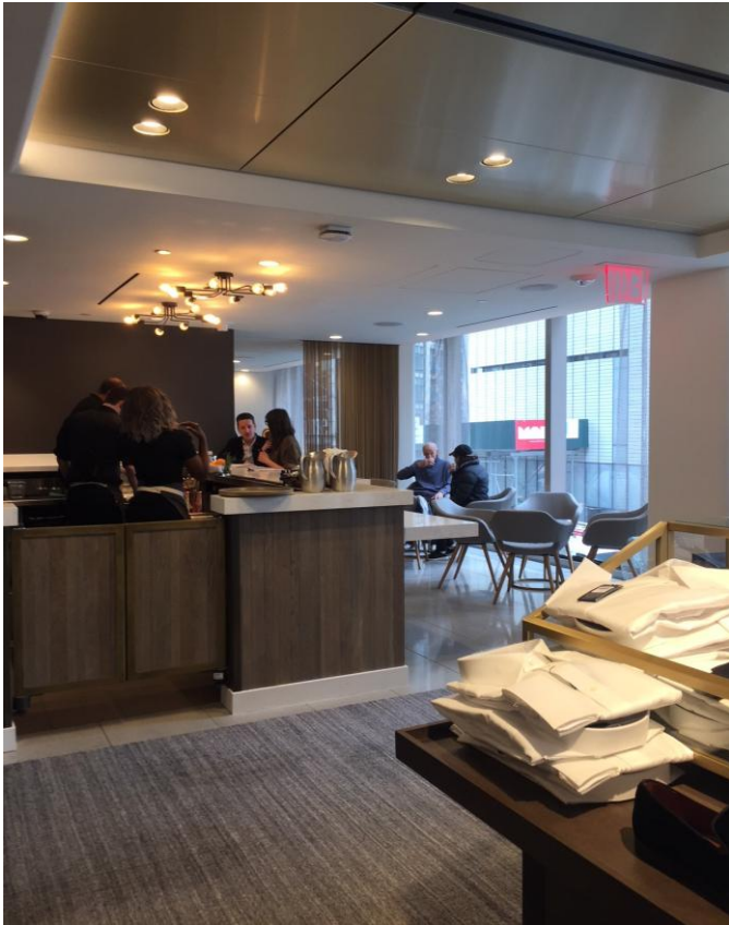
セントラルパークを臨むカフェ