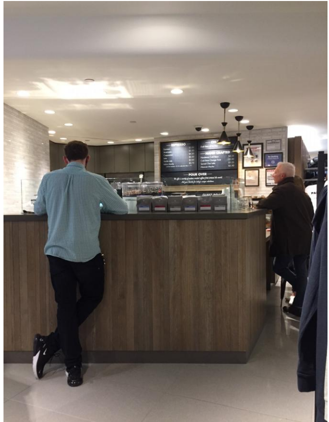
各階に設置されたカフェコーナーが客の滞留を促す