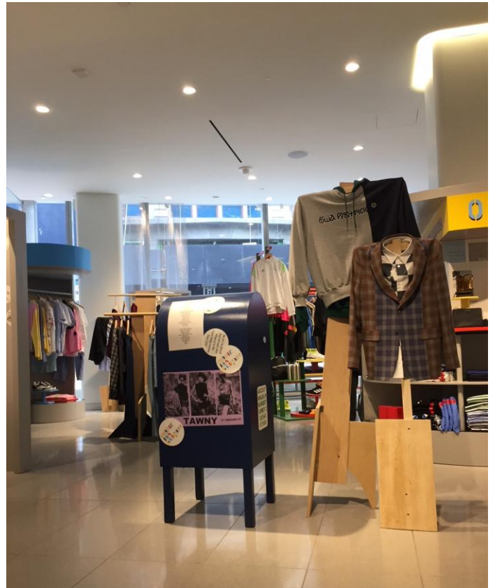
コムデギャルソンのショップイン SHOP