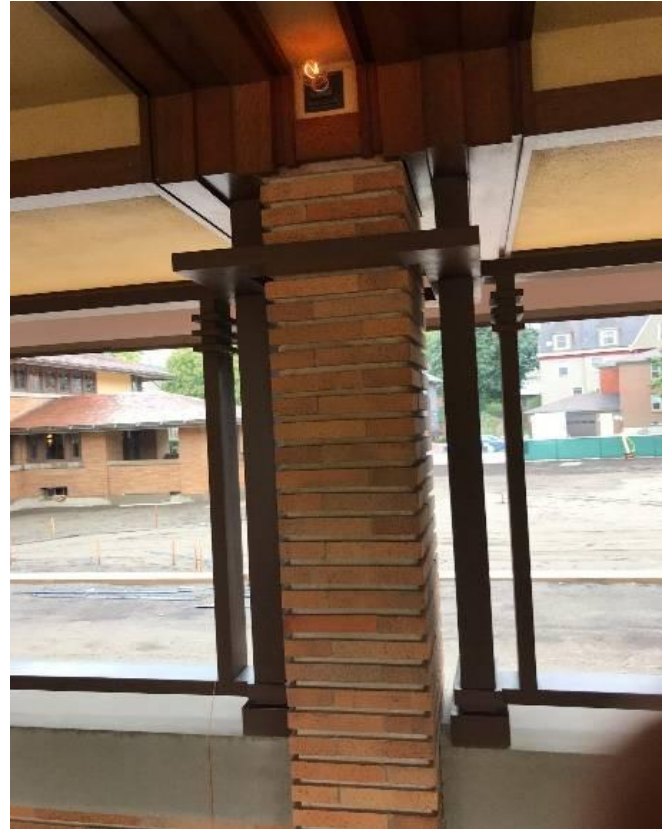
景色を額に入った絵のようにみるための木枠