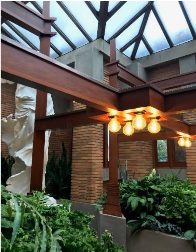
カスタムスカイライトと大きな女神の大理石彫刻