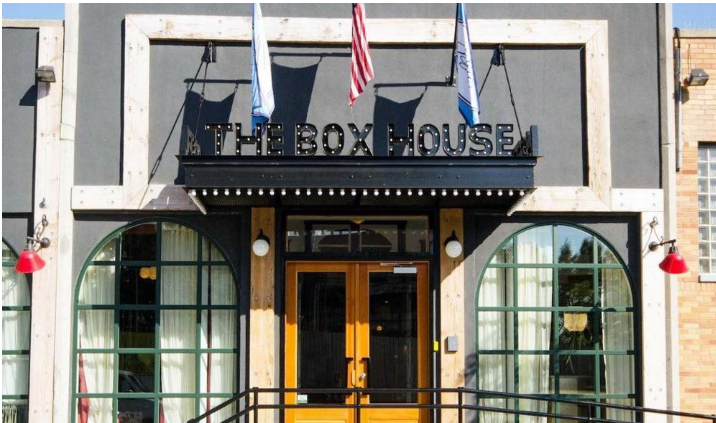
キッチン付きの長期滞在型の部屋が人気のブティックホテル The Box House Hotel