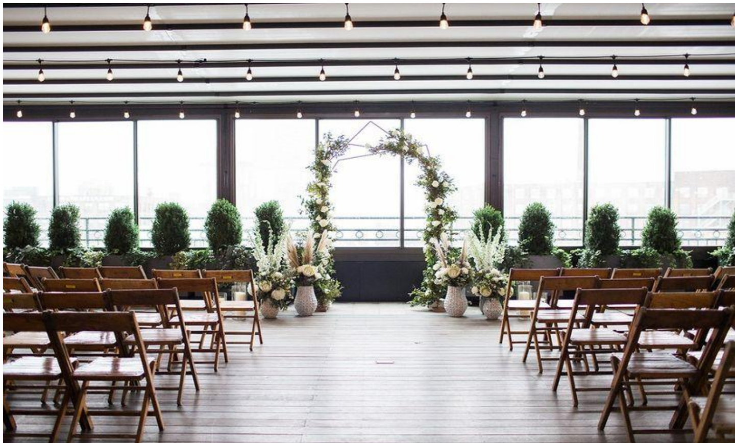
マンハッタンのスカイラインを背景に挙式ができるセッティング