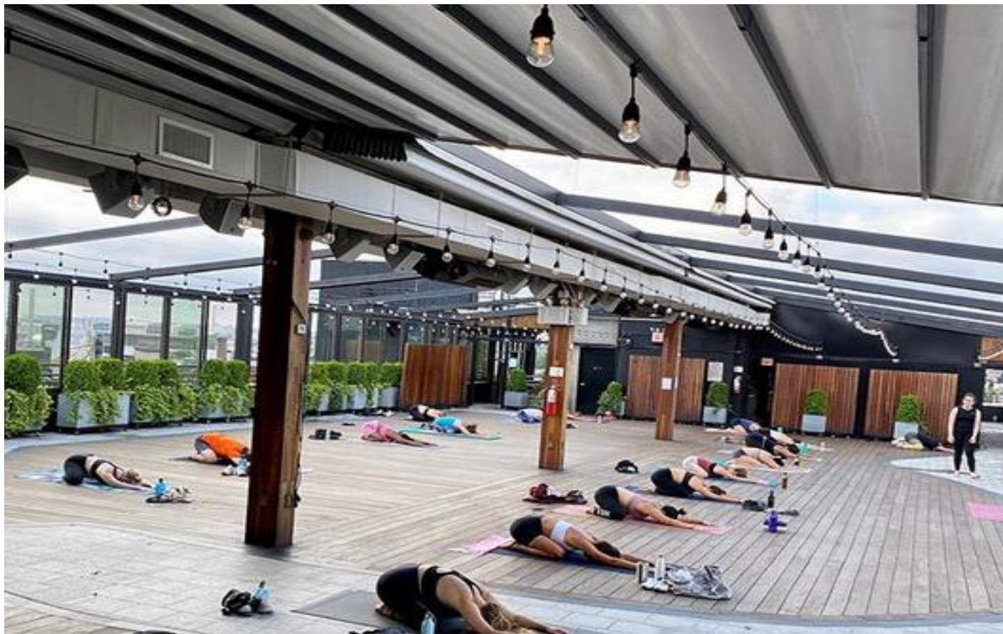
ソーシャルディスタンスをとりながらヨガ教室も実施