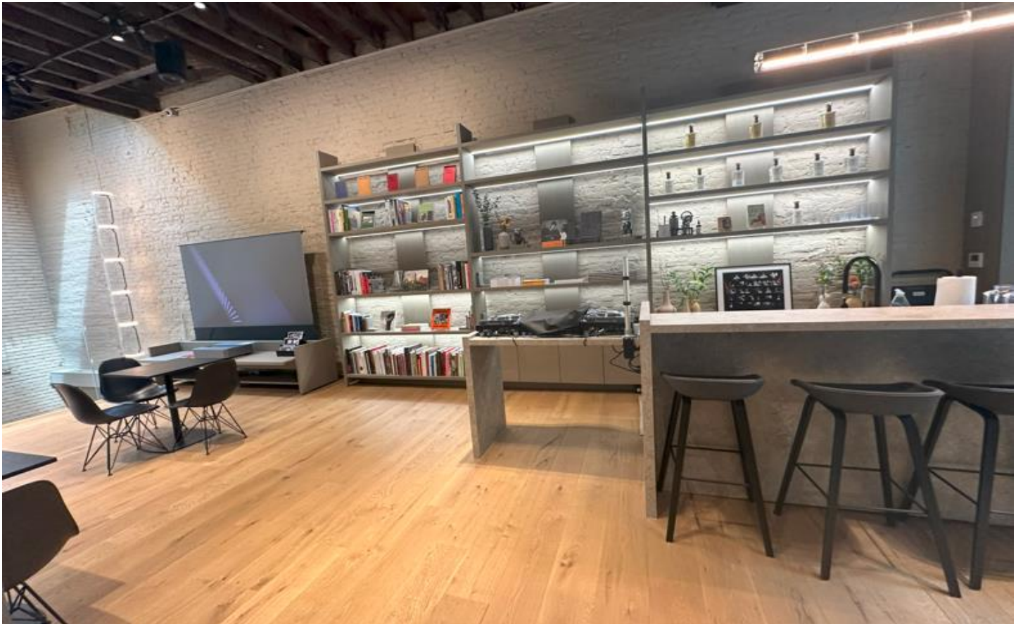
2階ラウンジ&ライブラリー