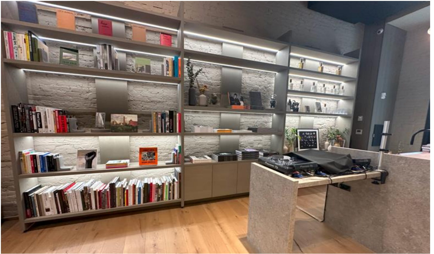
ライブラリー&DJブース