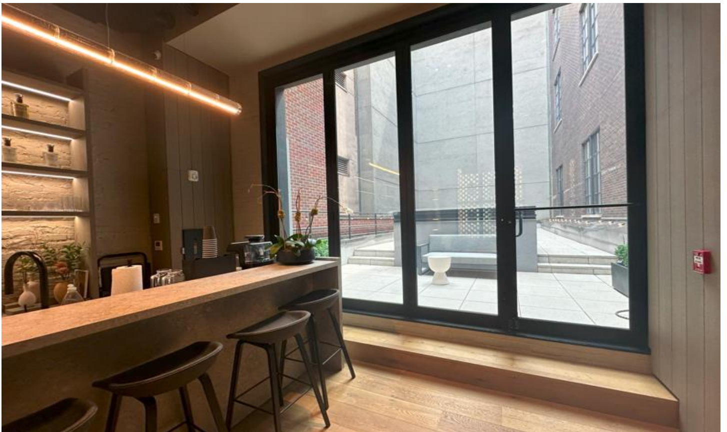
バーコーナーから、テラスに出ることもできる