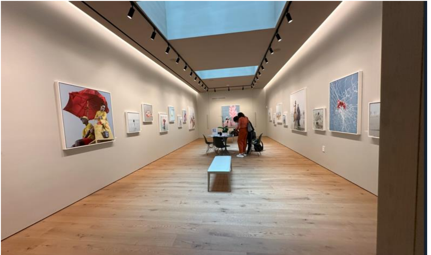
ショップ奥には、写真を展示販売するギャラリーが