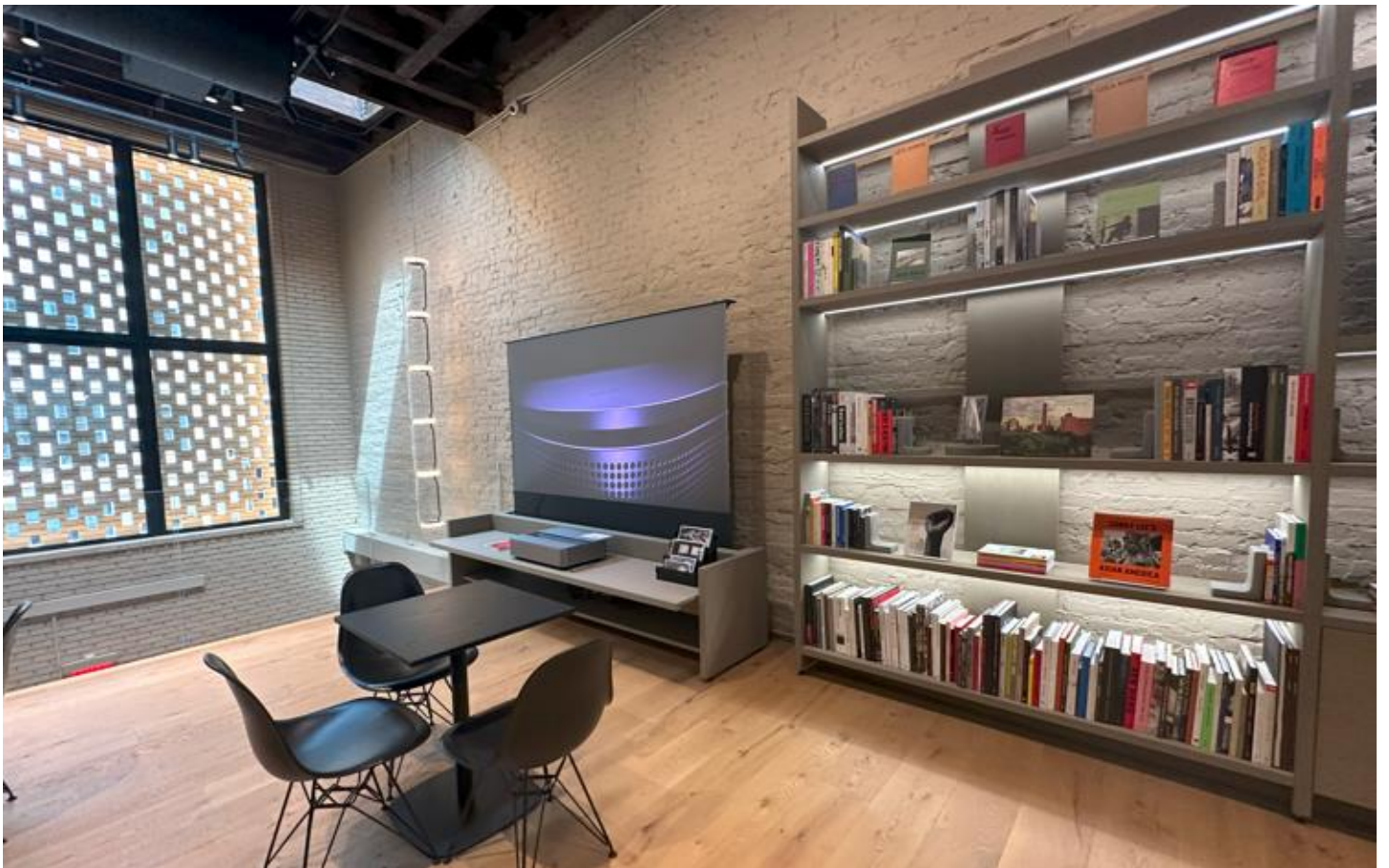
ライカ好きが集うことができるコミュニティスペース