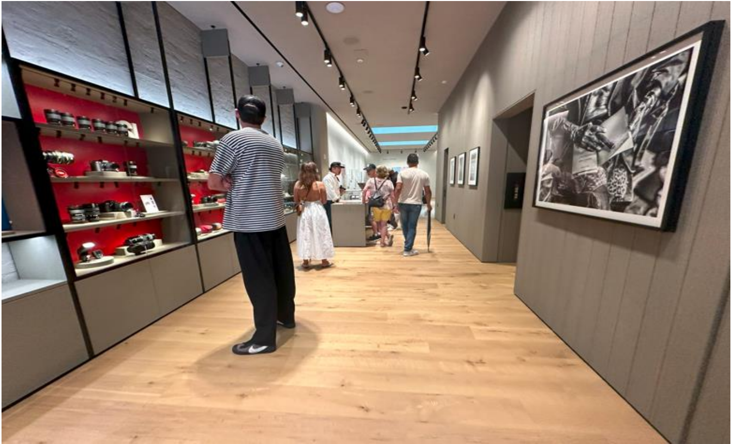
イメージカラーの赤を効果的に使った1階リテールスペース