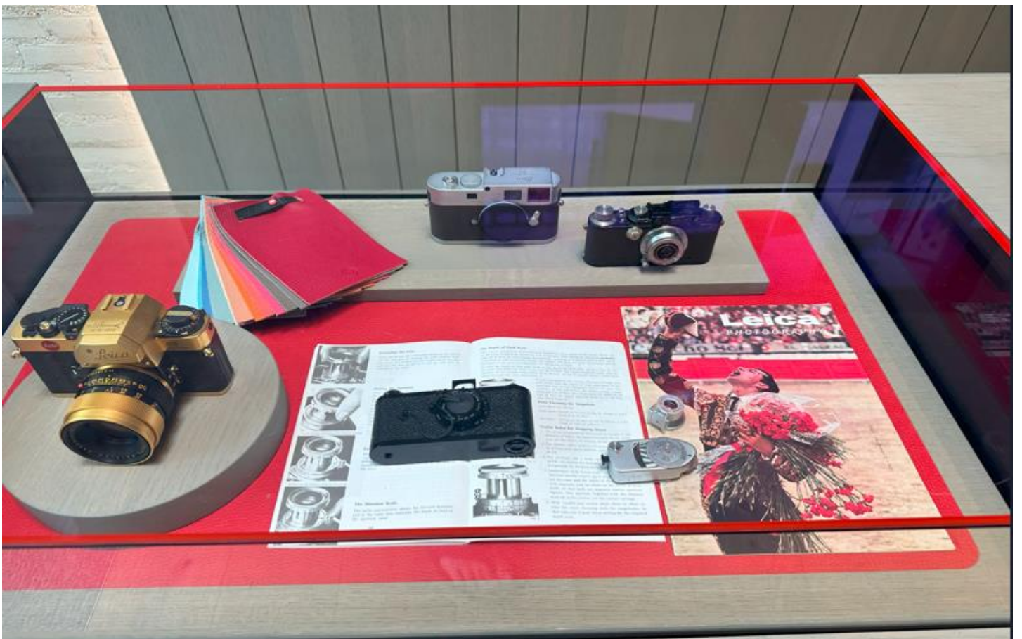
ライカ好きは何時間も滞在してしまう充実のラインアップ