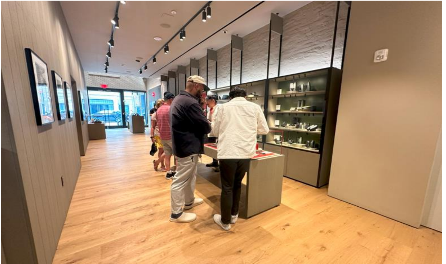
実際に商品を手にとって試しに撮影できるのも魅力