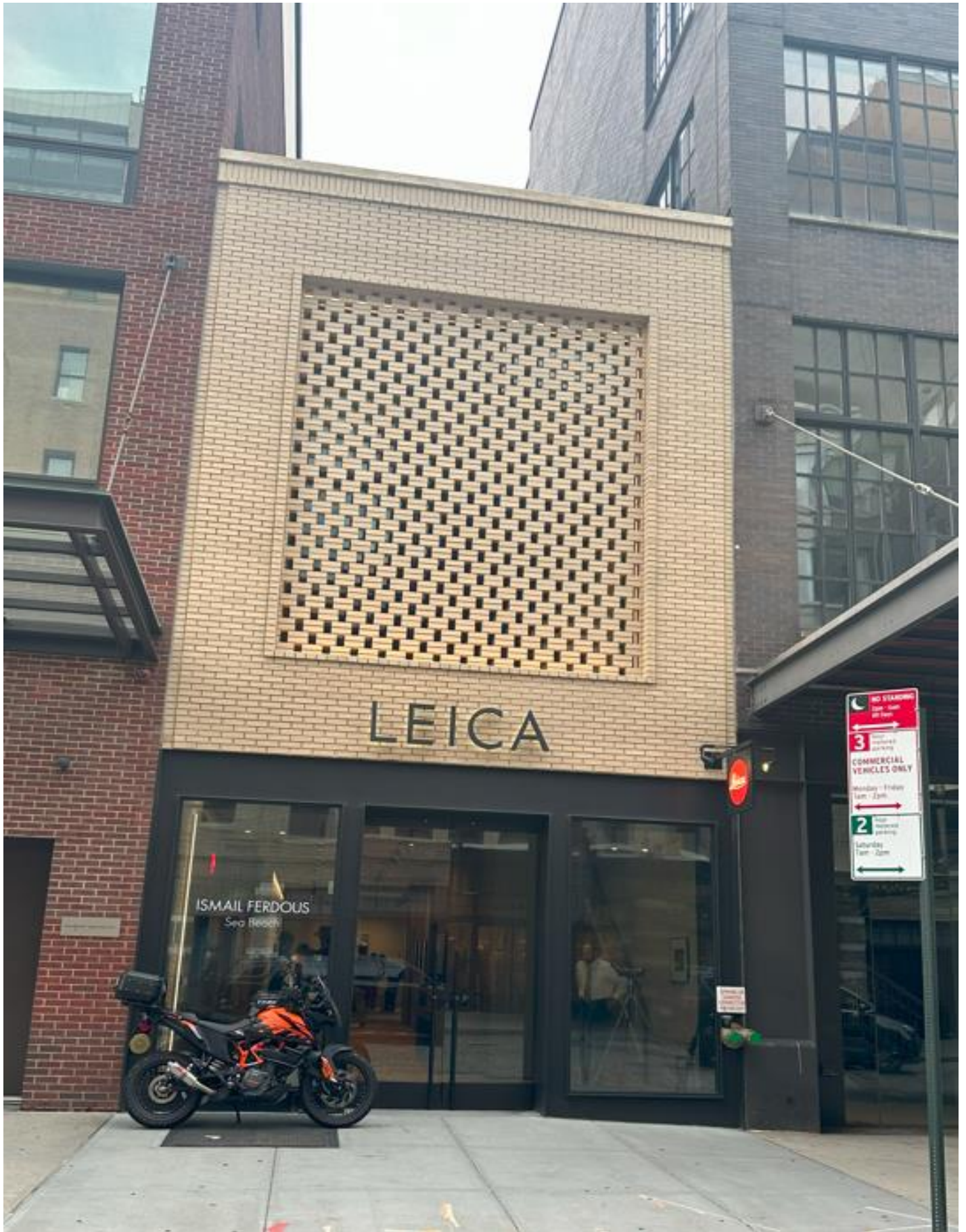
ミートマーケットの中心地に位置するビル全体がフラッグシップに