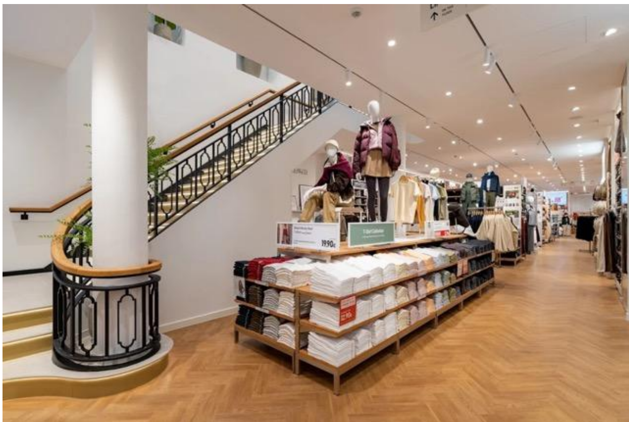
アントワープ店の店舗面積は、2フロア合わせておよそ 1,730 平方メートルである。