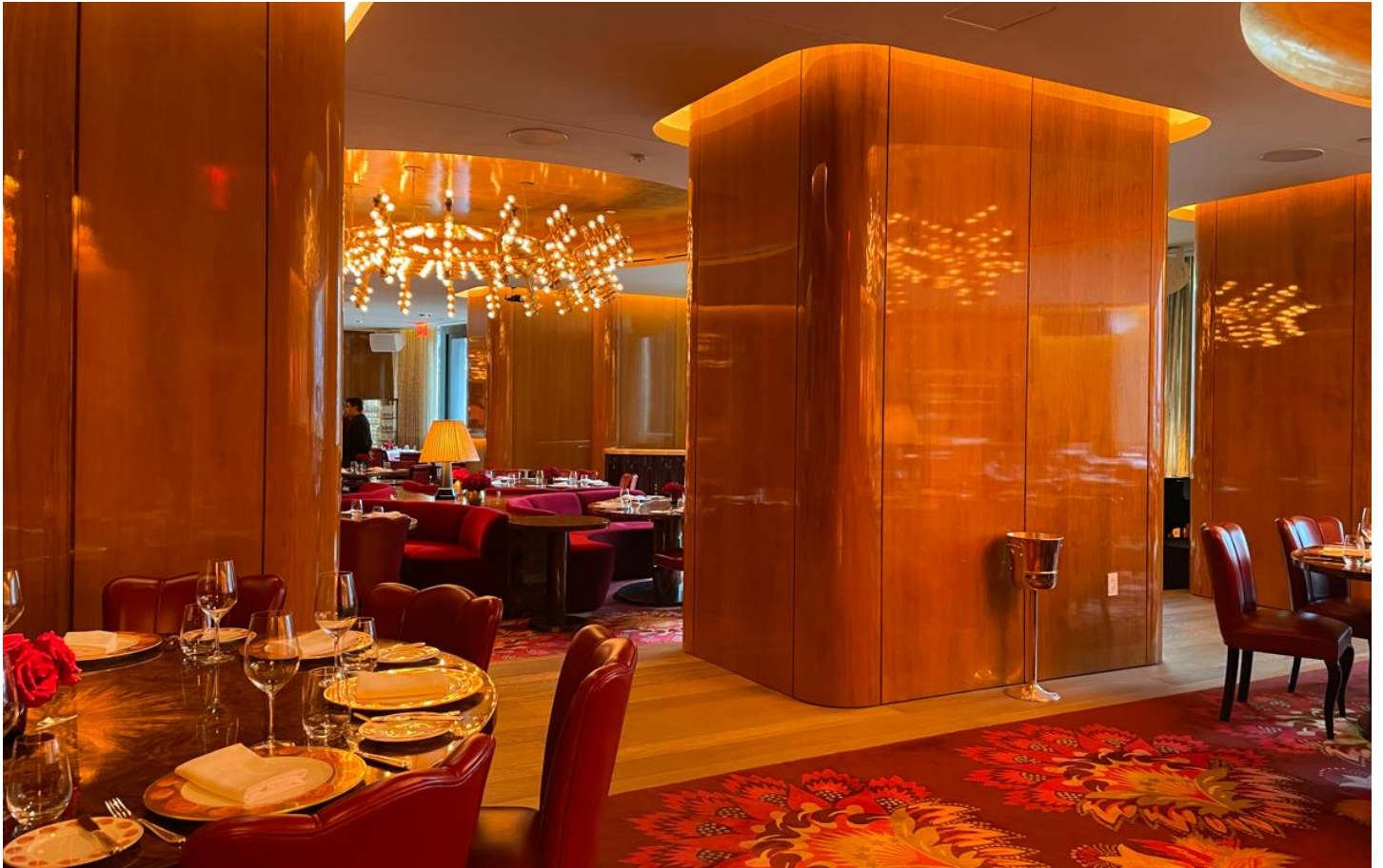
グラマラスなレストラン