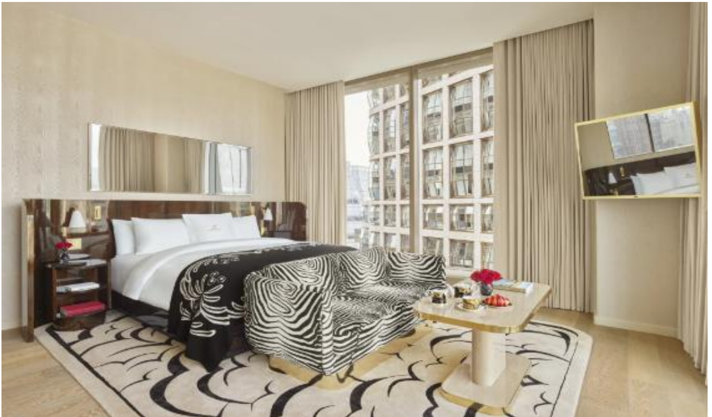
サファリをイメージしたアニマル柄が効いたインテリア