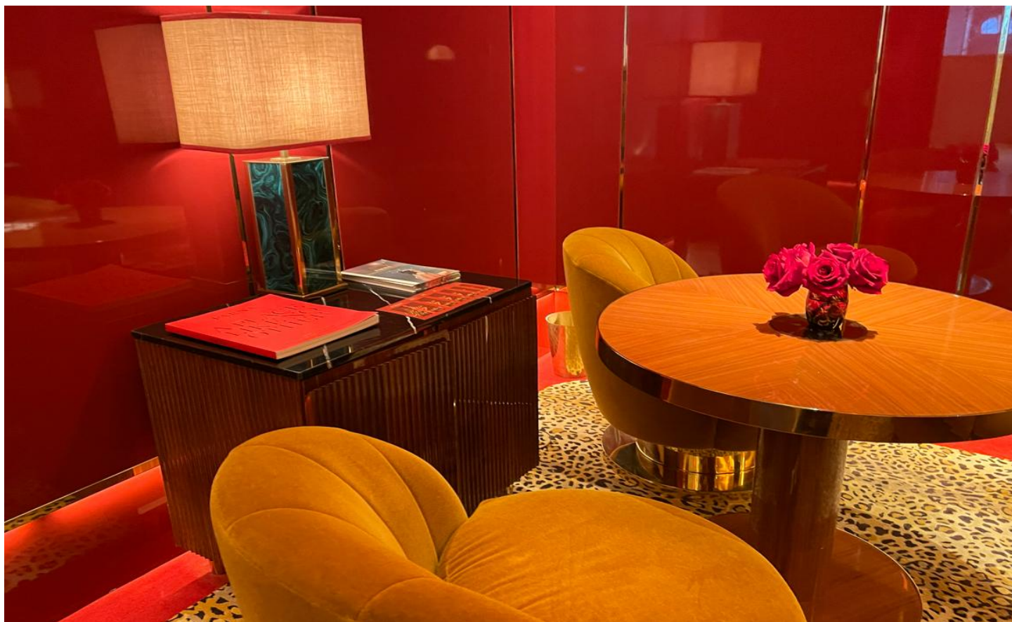
フロントロビーエリア