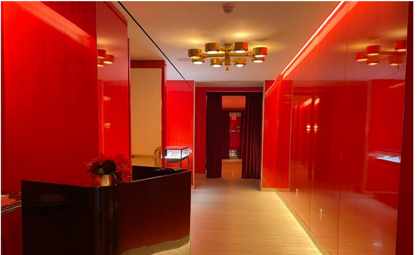
ドラマティックな赤を使ったロビーエリア