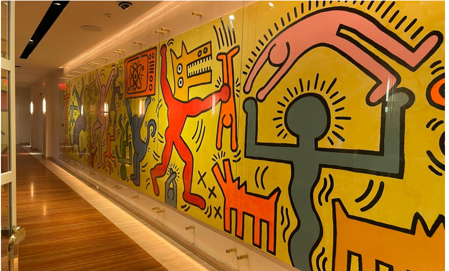
キース・ヘリングなどの作品が惜しみなく飾られる