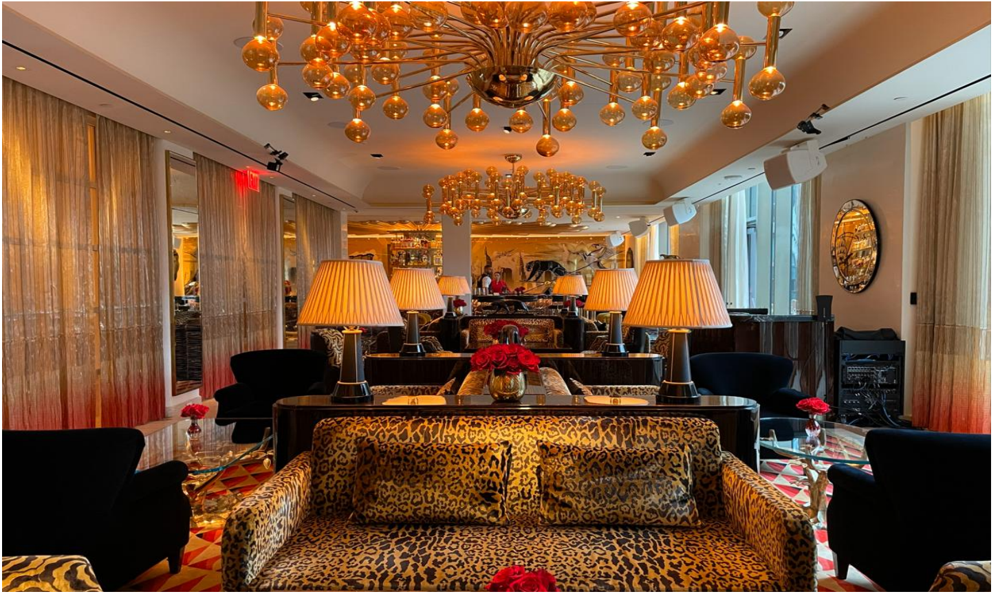
ロビー、1階のレストラン、2階のバー、それぞれのセクションでデザインが変わる