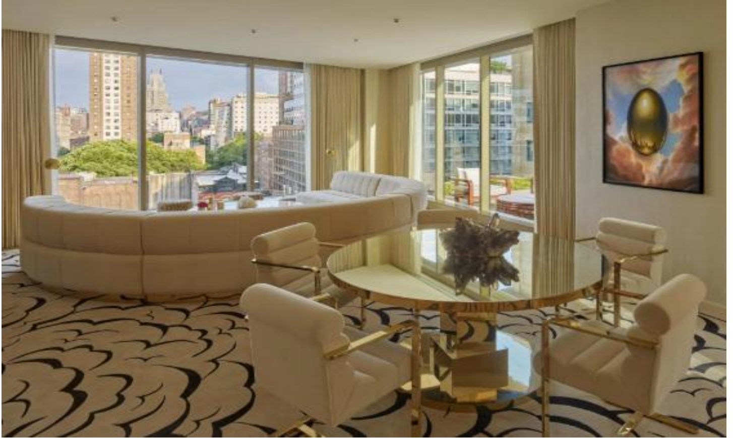
天井までの解放感ある窓が特徴の客室