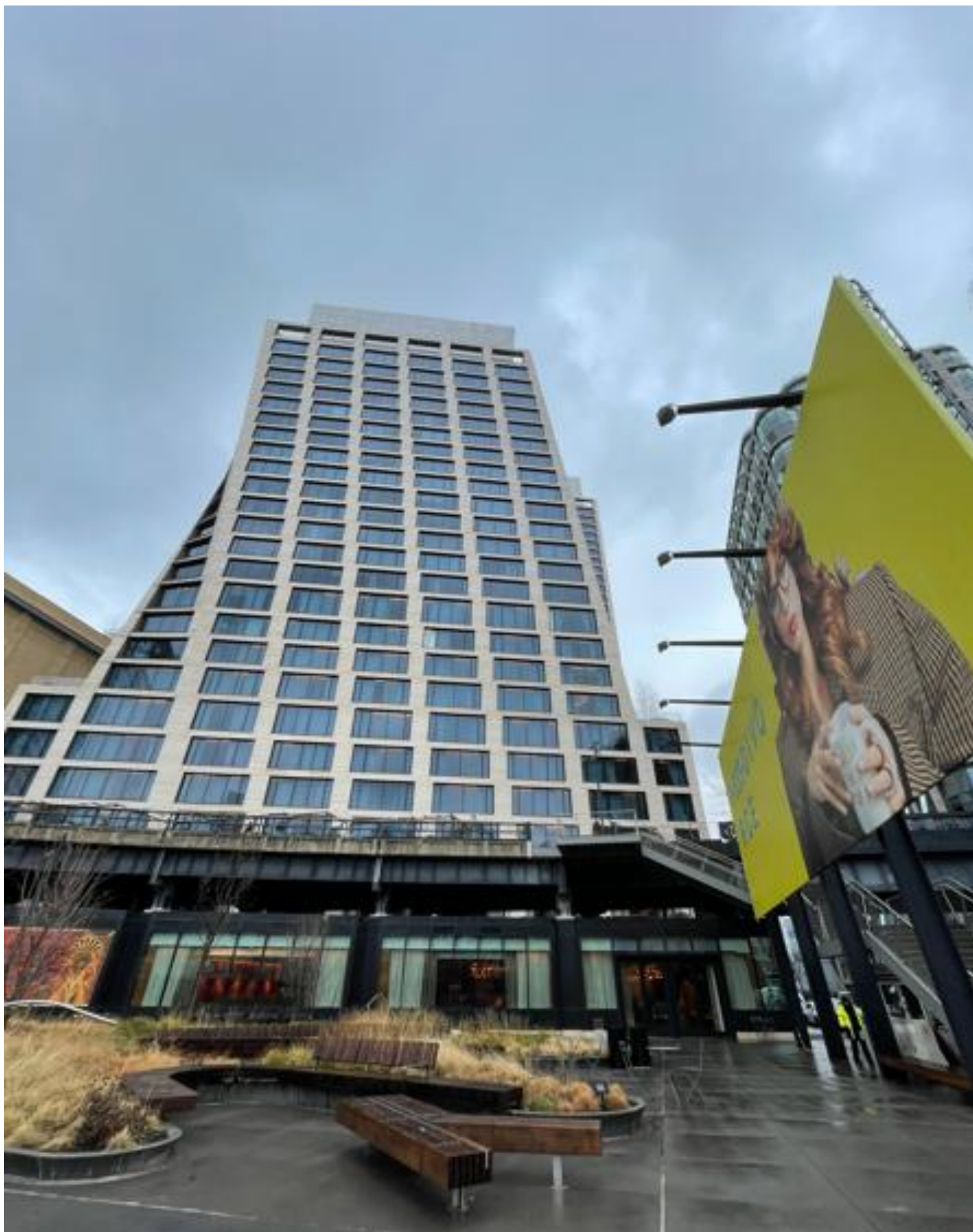
人気観光スポット、ハイライン・パークに隣接するホテル