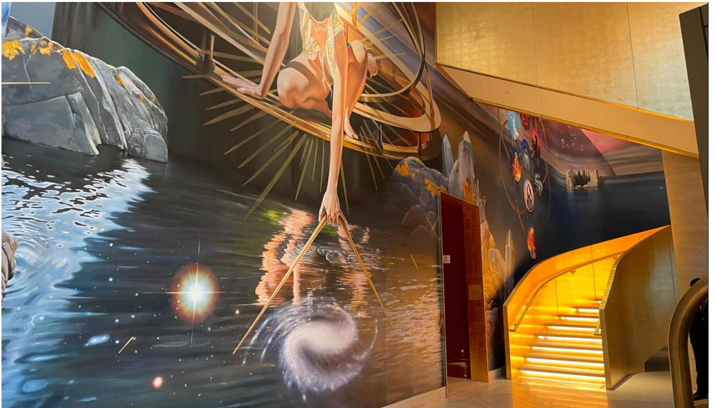
アルゼンチンアーティストによる巨大な壁画