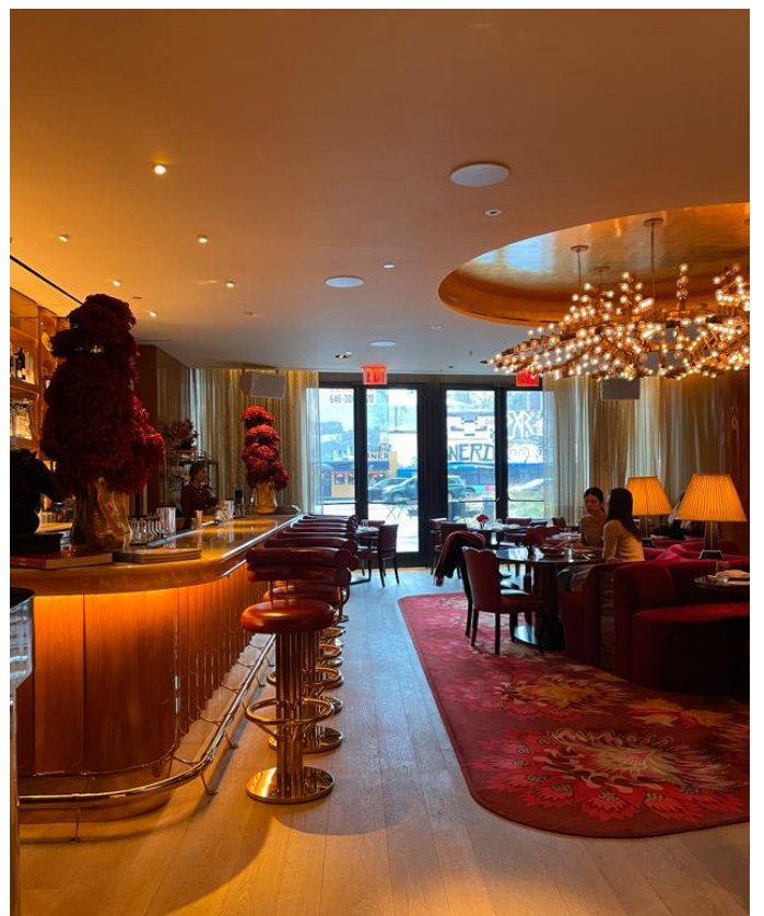
宿泊客以外の利用も多いバーエリア