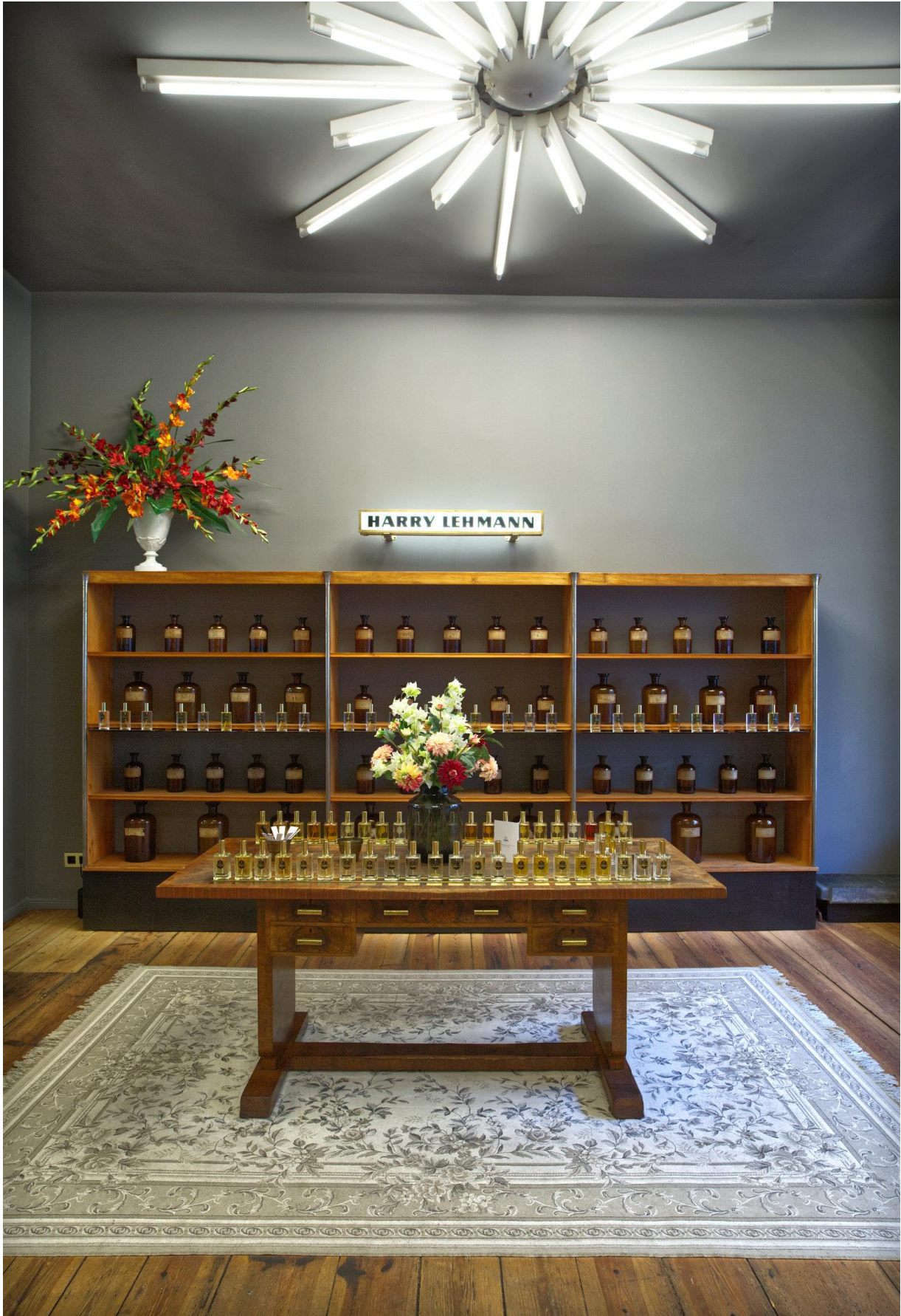
适合现代空间的 1950 年代家具。地毯上的图案灵感是过去出售的人造花的形象。过去人们会在人造花上喷洒香水，用来替代鲜花。