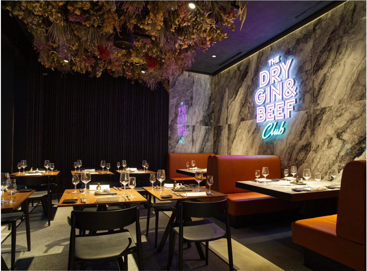
上图：杜松子酒中使用的植物悬挂在天花板上。 下图：杜松子酒的货架形状类似于传统的药店货架。