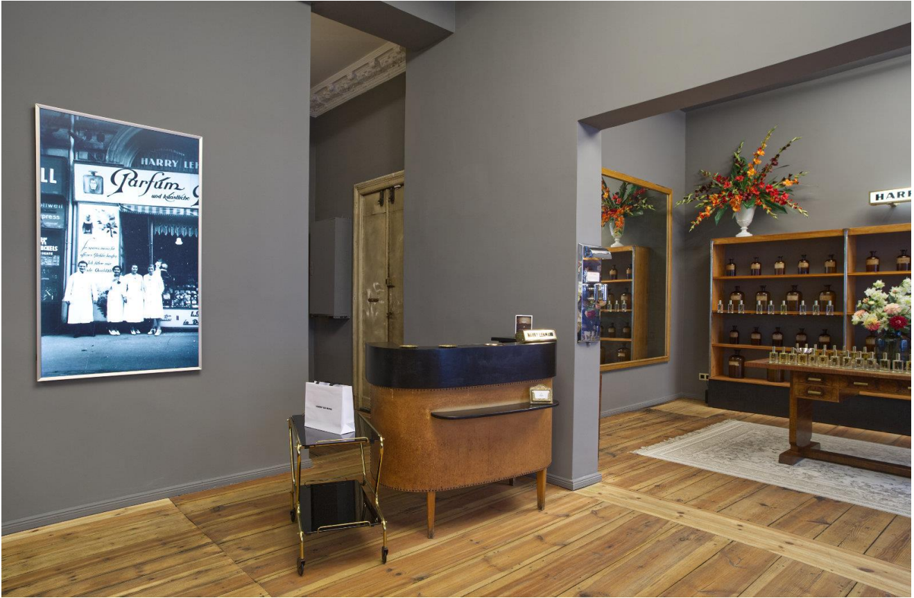
上图：随意摆放着创业时的照片。 下图：外面的招牌自 1958 年以来没有改变。