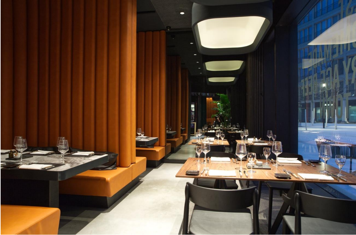
上图：后面的座位区由皮革制成，像私人房间一样隔开，营造出一种私密感。 右下：灵感来自烤肉的角落。