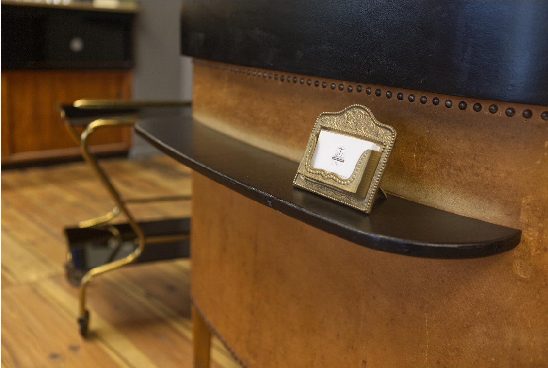
上图：通过更换台面，旧柜台焕然一新。 右下：香水喷雾器曾经安装在面向街道一方，让过路人可以尝试到“当天的香味”。 左下图：一面大镜子，为这个摆放着厚重家具的空间营造出了宽敞的氛围。在一个角落里，您可以尝试从香水到香薰蜡烛等所有试用品。