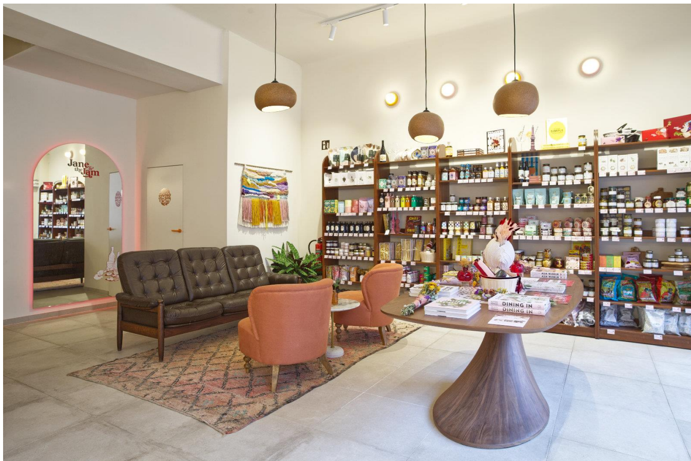
上图：店铺空间。色彩缤纷的设计吸引了许多顾客。下图：收银台后面是葡萄酒吧。镂空壁用作遮挡视线。