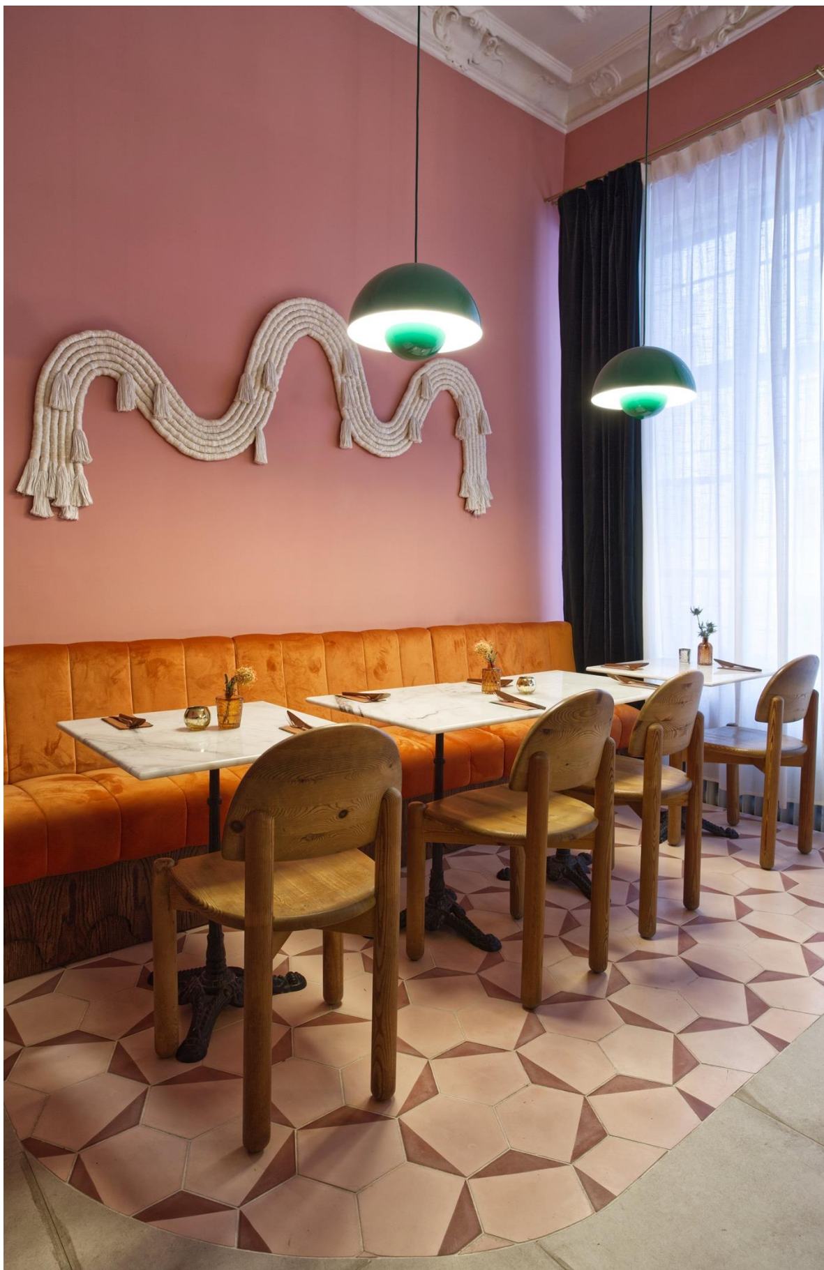
地砖和墙上的小物件让整个空间充满节奏感。复古的墨绿色灯具将室内装饰融为一体，避免了过于甜腻的感觉。