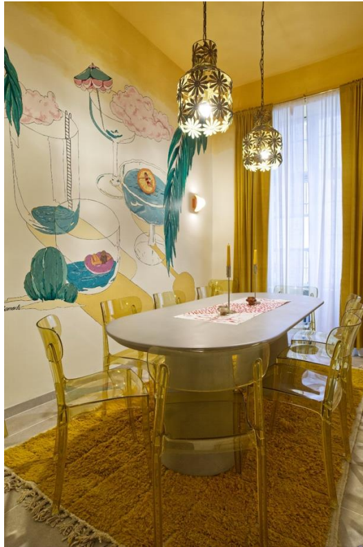
上图：私人房间也可用于会议包房。

左下图：供暖系统也涂成了橙色，植物为其增色不少。右下图：法式小酒馆形象。配饰与精致的橙色相应搭配。