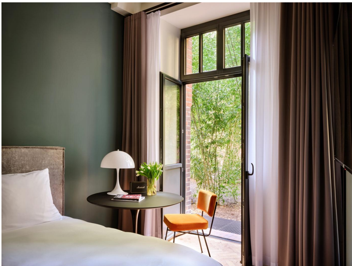
上图：路易斯·保尔森 (Louis Poulsen)的台灯等小物件均选用曲线造型。下图：以动态木质隔断作为空间点睛之笔。