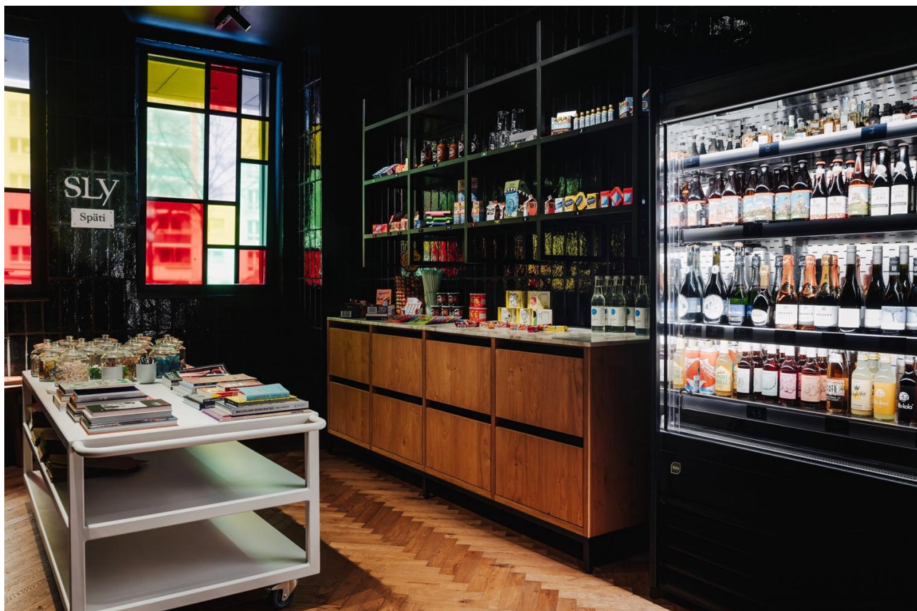
上图：酒店室内不设迷你吧，改为开设销售饮品与设计饰品的商店。下图：餐厅在夜幕降临后呈现出截然不同的氛围。