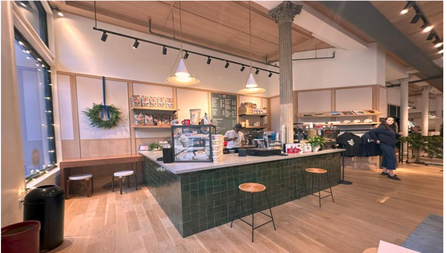
咖啡厅一角还出售糕点和其他商品