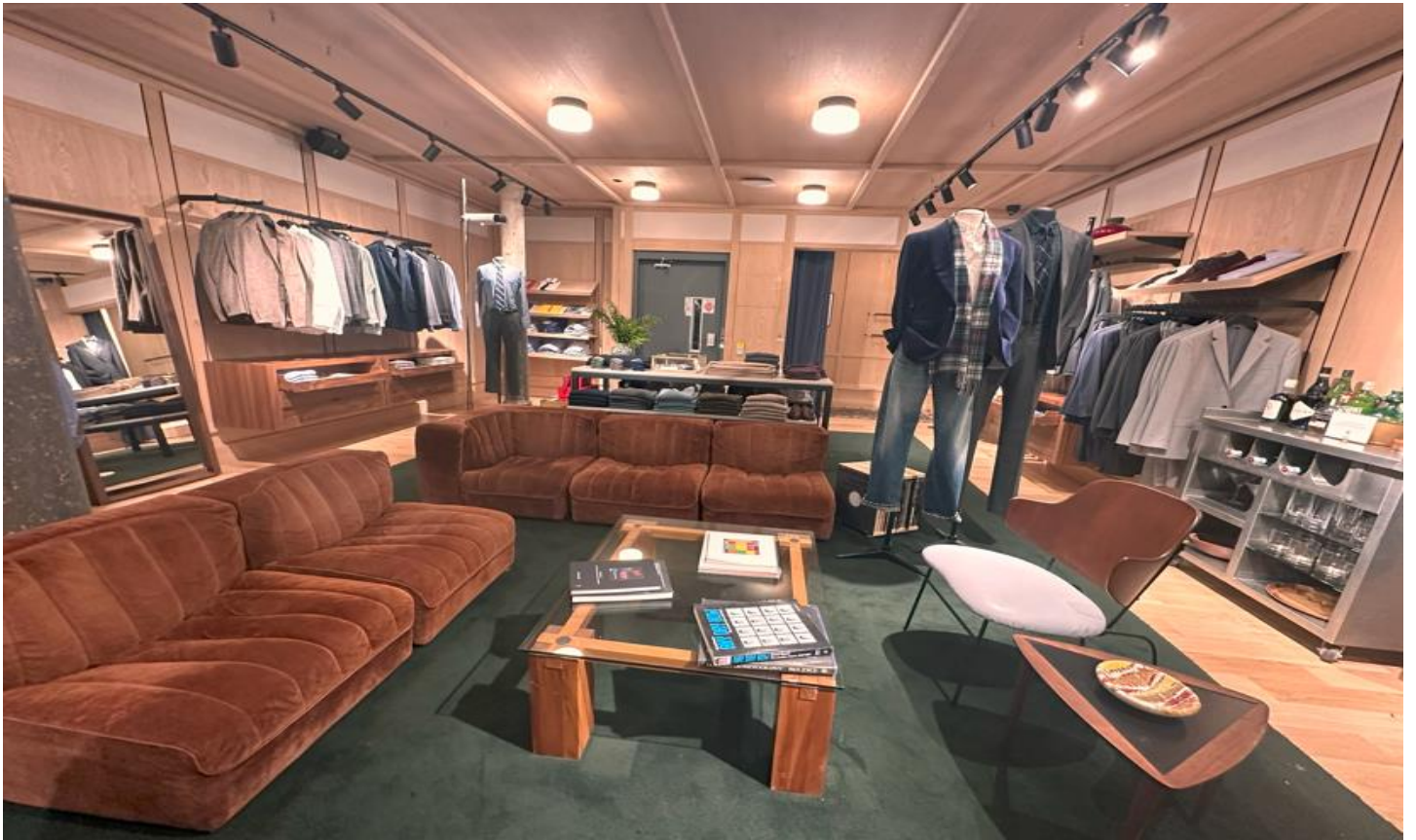
地下室是一个别致的休闲空间