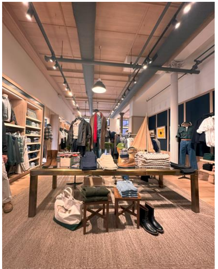
为汉普顿海滨和纽约市提供的各种商品