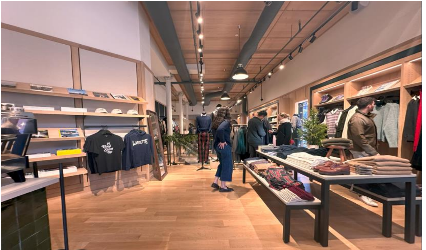
一楼摆满了街头和城市组合的休闲商品