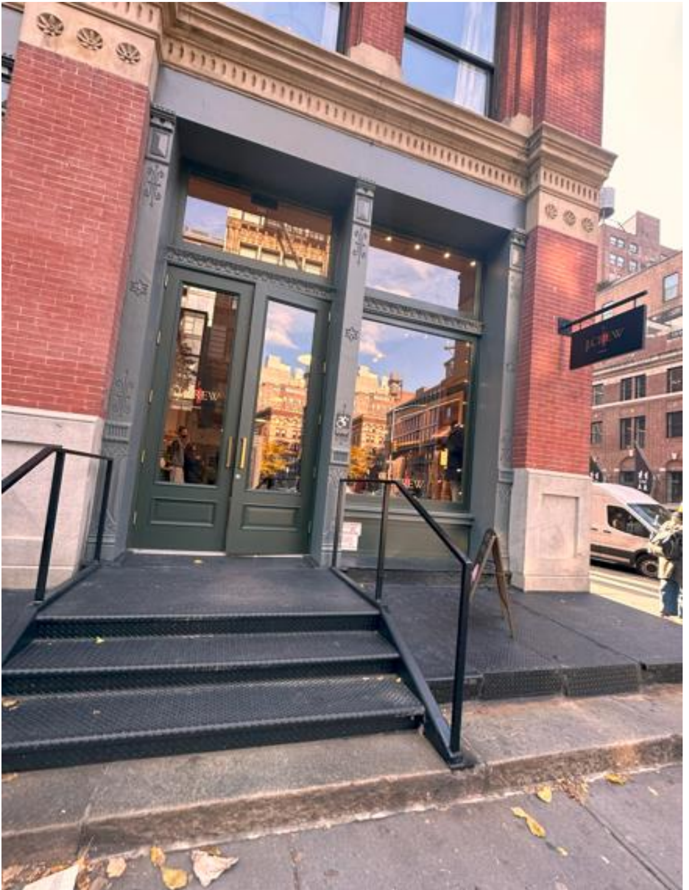
外观沿用原有红砖外墙