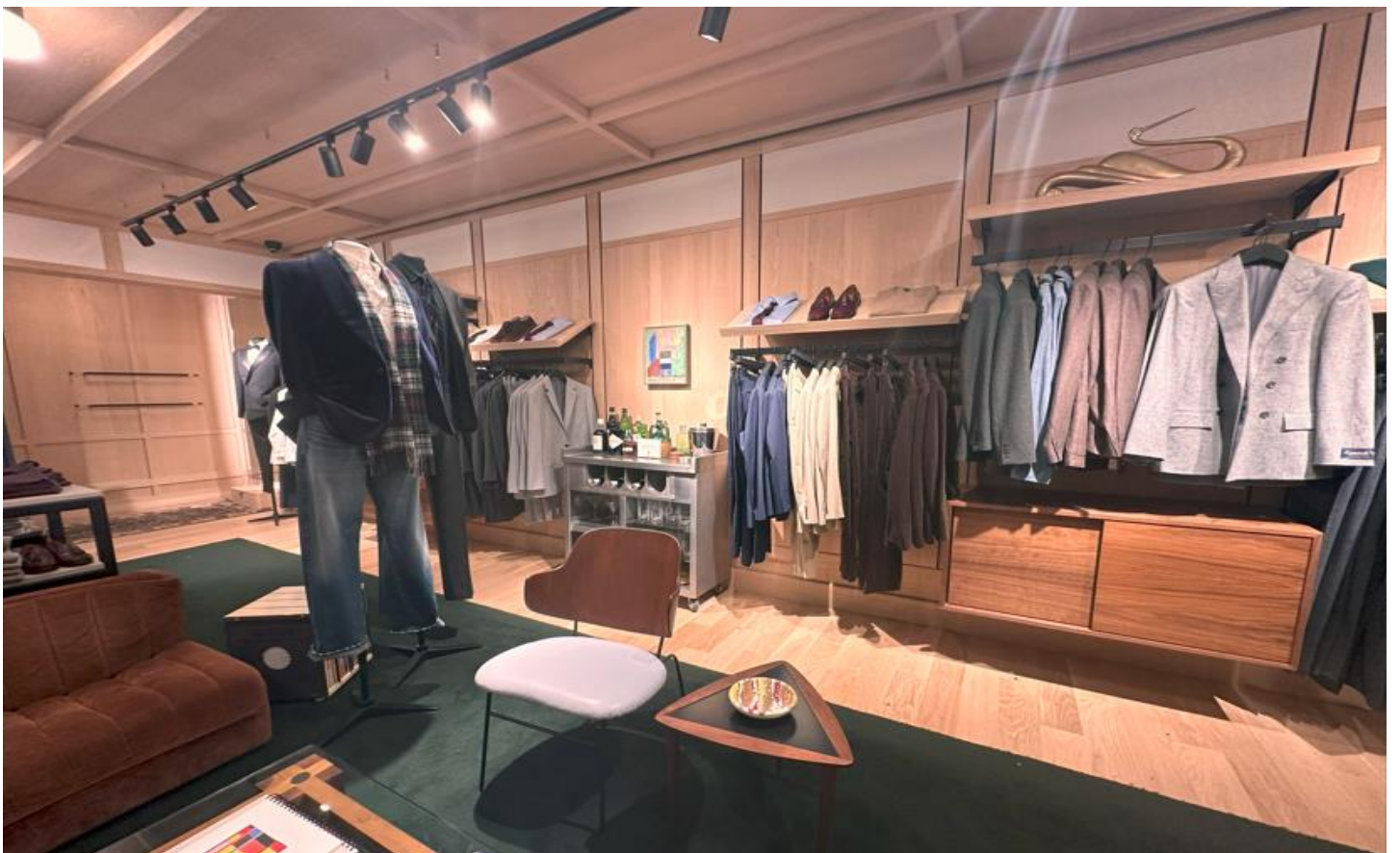
体现都市时尚风格的室内设计