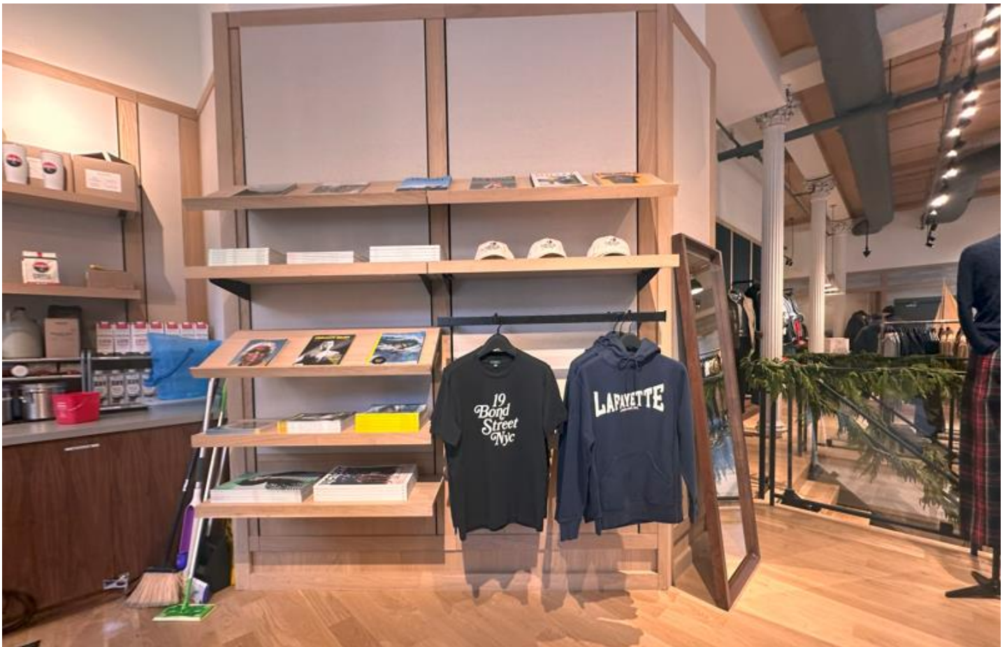
邦德街独家商品和艺术书籍