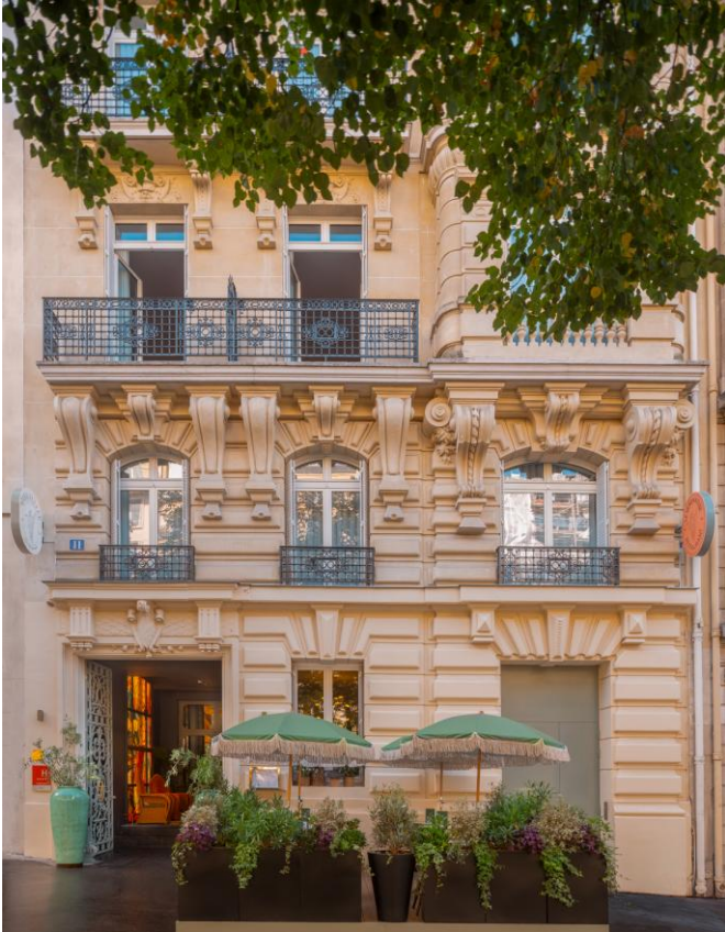
建筑立面