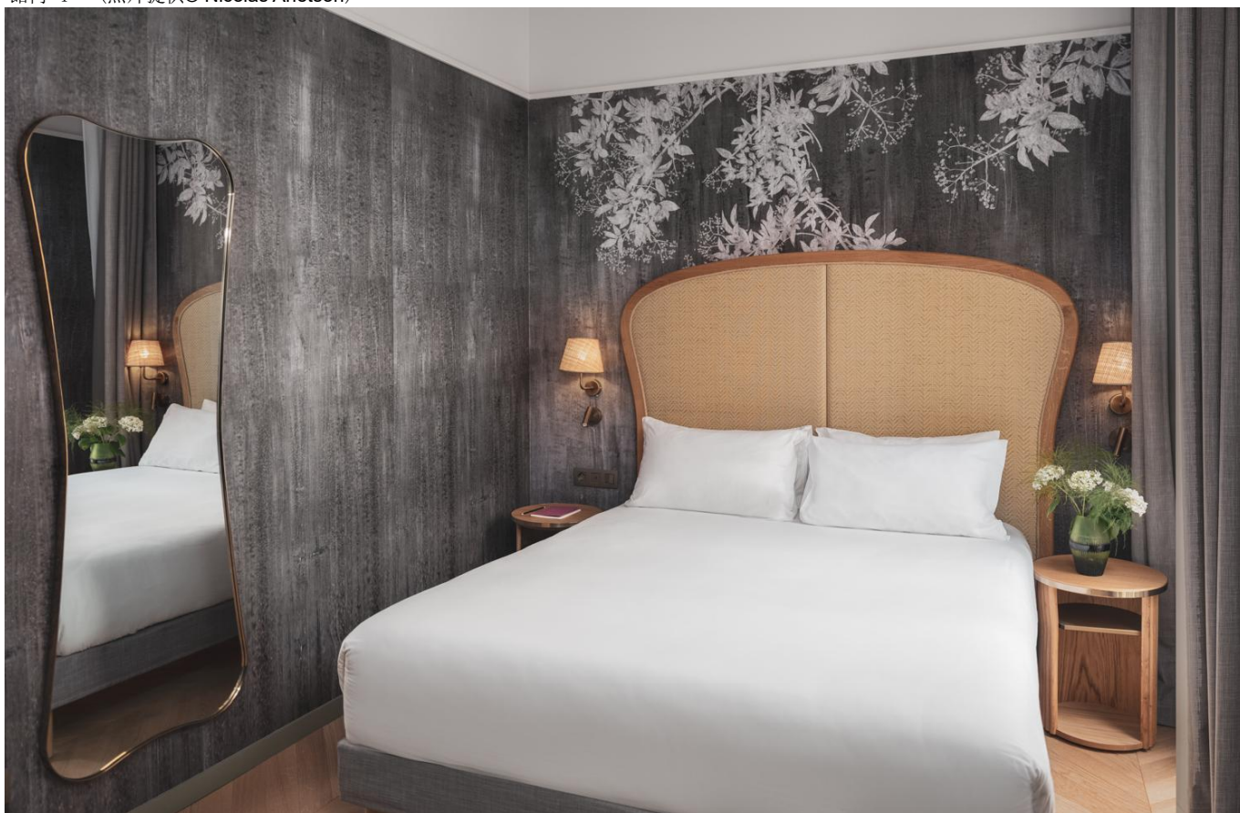
館内 5