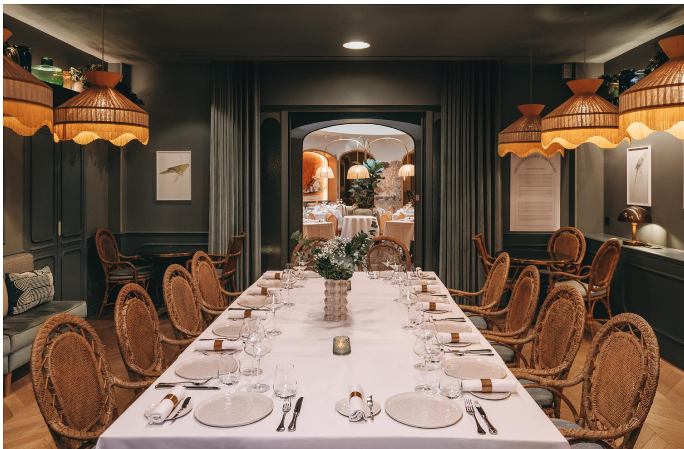
館内 4