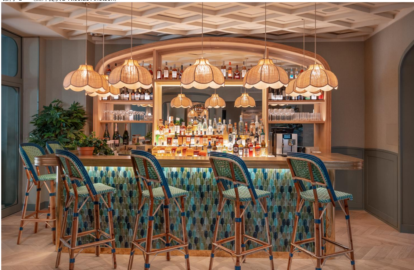
館内 3