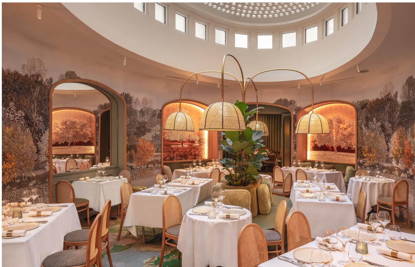
館内 2