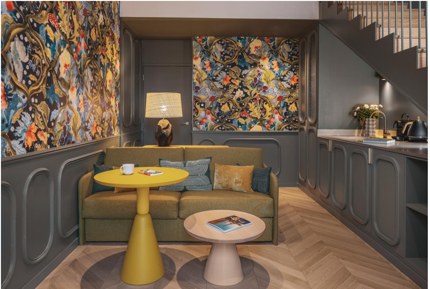
馆内 1