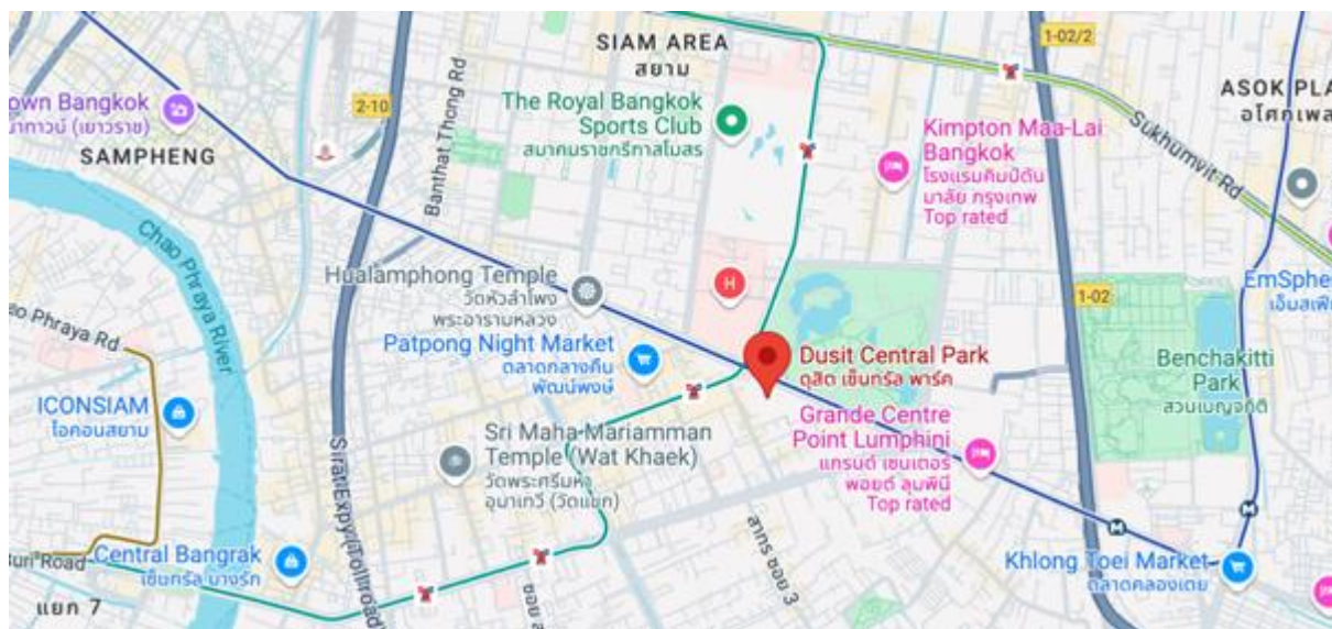
都喜中央公园 (Dusit Central Park) 位于席隆路与拉玛四路交汇处，毗邻伦披尼公园 (Lumpini Park)，紧邻沙拉丹轻轨站与席隆地铁站。