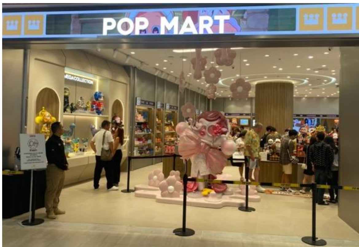
2 楼 Pop Mart 店内采用柔和的粉彩色调装饰，营造出一个非常适合拍照分享到社交媒体 (SNS) 的绝佳空间。