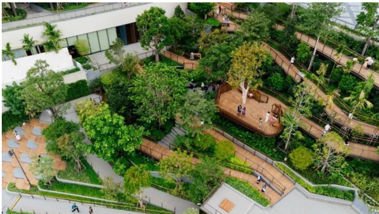
该综合设施的最大特色是横跨 4 至 7 层的「都喜阿仑酒店屋顶花园」。在这片绿意环绕的静谧空间中，可尽享开阔的城市景观。