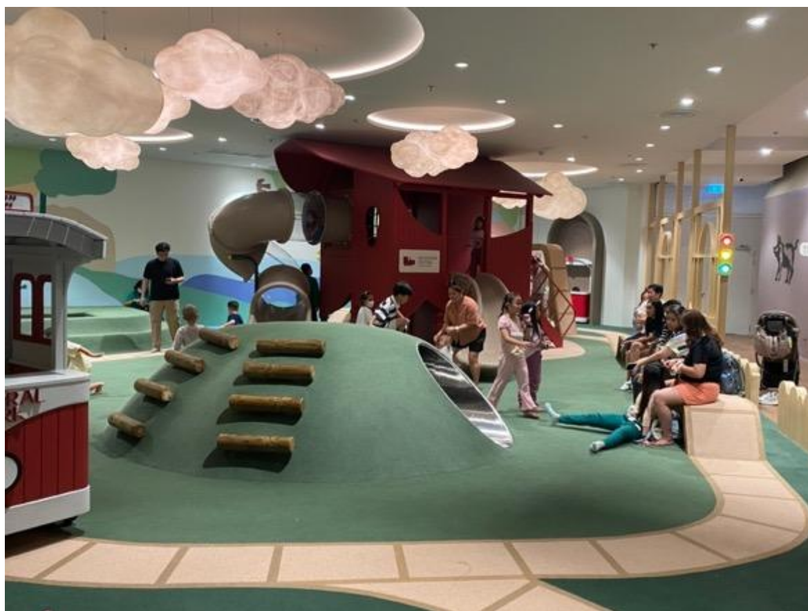
酒店还设有专属儿童游乐区