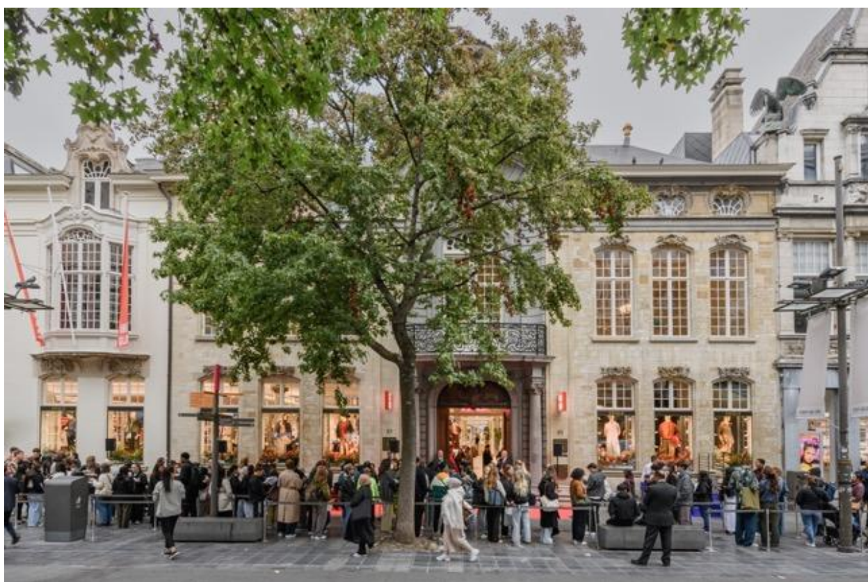
优衣库旗舰店在安特卫普梅耶街 (Meijer Strasse) 的标志性建筑奥斯特里特宅邸 (Osterrieth House) 开业。排队等候入店的顾客多达 500 人。