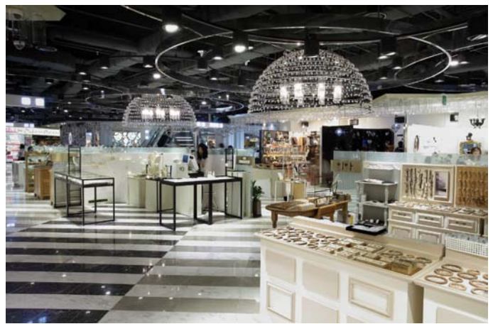
View of the space design at 4F and 6F 4階と6階のスペースデザイン