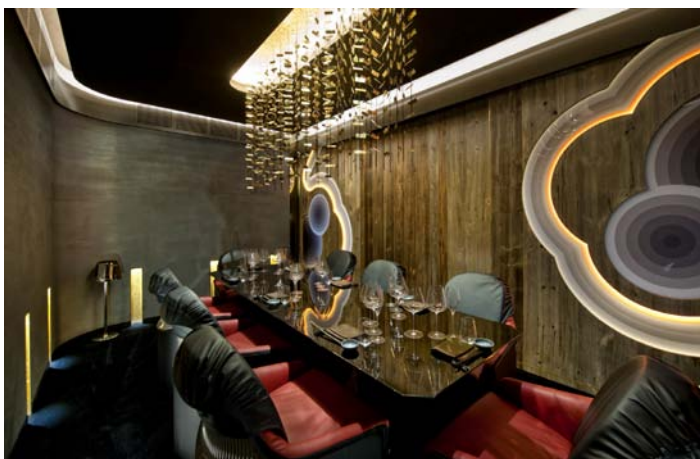
View of the private room with weathered wall boards engraved with symbolic images of ancient Japanese paintings.