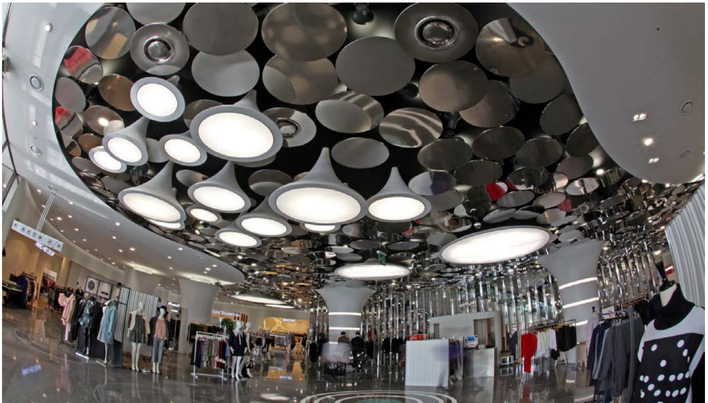
View of the ceiling lighting at 1F 1階の天井と照明

The renovation of 'doota!' shopping mall, designed by Garde, opened in September 2014. The mall is located in Doosan Tower in Dongdaemun district near Zaha Hadid's Dongdaemun Design Plaza (DDP). The historic Dongdaemun Market, popular with its cafe and retail stores, is the perfect location for this fashion oriented shopping mall. Garde has been responsible for the transformation of the space into a pseudo-reality that brings the spectator into a different world. Garde has created an overarching rule that governs each floor to encompass the design of each individual shop. The overall design concept is the exploration of 'Another World'. Each floor aims to project the customer into a different and strange environment inspired by natural phenomena. Each floor offers distinct narrative that captures the imagination. At the basement floor, the visitors enter a blue lagoon where the concept is life 'In the Sea'. A mysterious atmosphere surrounds the customers as light emanates through the waves with a dramatic effect. The first four floors are inspired by the image of a subterranean cave. A 'Secret Garden' welcomes the visitors at 5F and 6F and encourages the exploration and quest for healing products. The interior at the 7F and 8F offers an airy environment that is designed with the concept of 'In the Breeze'. From cosmetics to interiors, this innovative space design takes the customer's shopping experience to another level.