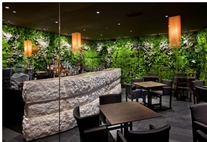
View of natural stone counter and the vertical garden.