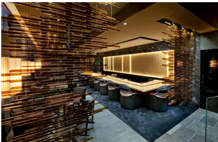
View of the 8-meter sushi counter and the glass partitions.

The 8-meter long sushi counter is a masterpiece made of Japanese cypress wood called hinoki . The VIP room features weathered wood panels with a design pattern that recalls the ancient paintings of the Shinto gods of Thunder and Wind. The skillful use of light and shadows creates a dramatic atmosphere yet all rooms are harmonious in creating a unique spatial arrangement.