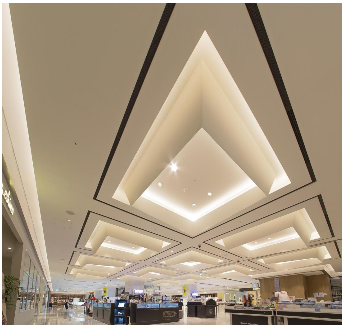
A view of the 1st floor

GARDE U.S.P(ギャルド ユウ・エス・パイ) が手掛けた「現代シティアウトレット東大門」は、韓国初の都市型アウトレット・ライフスタイルモールで、都市の中心でありながら、高級ブランドから低価格商品まで幅広く展開しています。コンセプトは"A wonderful warehouse"倉庫のようにシンプルなスタイルに、最新の IT テクノロジーも用いてスマートデバイスとの連動も図り、FRESH~新鮮~な情報を発信する HYBRID な場所です。