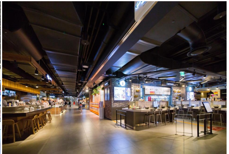
BF2 view 地下2階