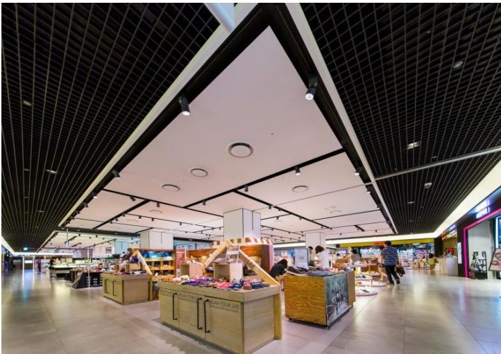
BF1 view 地下1階

この「現代シティアウトレット東大門」を通じて、HYUNDAI はお客様に商品とデザインを通じて、新しい感覚を目覚めさせる機会を創出しています。